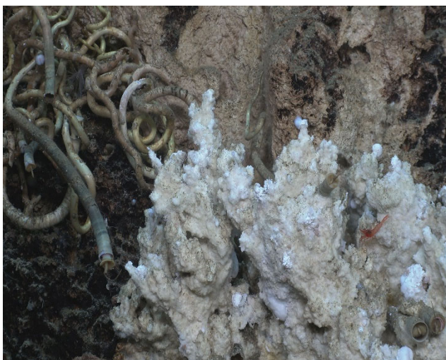
Abbildung 3: Helle Baryttürme mit Bartwürmern, die kalte Quelleaustritte am Meeresboden entlang der San Clemente Blattverschiebung charakterisieren. Die weißen Stellen sind Mikroben, die von austretenden Fluiden sich ernähren