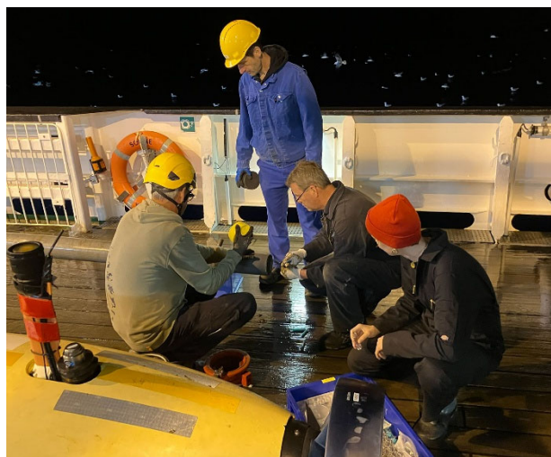
Abbildung 4: Nächtliche Beprobung eines Schwerelotes an Deck der SONNE. Nachdem das Schwerelot gelascht und die Kranarbeiten eingestellt sind, können die Wissenschaftler das Schwerelot beproben

Der Tauchgang führte über die morphologisch ausgebildete San Clemente Blattverschiebung auf die gegenüber-liegende konjugierende Scholle, wo die auftretenden Barytvorkommen an Größe enorm zunahmten und die hellen aktiven Bereiche der frischen Barytausfällung vermehrt erschienen. Weitere AUV-Kartierungen und ROV-Tauchgänge bestimmten neben CTD und Schwerelot- und MUC-Stationen unser Wochenende auf See. Das unglaublich gute Wetter hat uns auch diese Woche erlaubt alles ohne wetterbedingte Ausfälle zu tun. Fahrtteilnehmer (Besatzung und Wissenschaft) sind wohl auf!