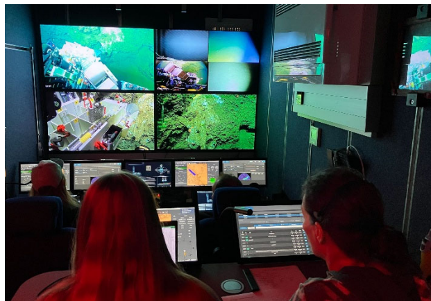
Abbildung 2: Vom Kontrollcontainer von MARUM QUEST 5000 wird der Roboter von zwei Piloten gesteuert. Hinter den Piloten sitzen zwei Wissenschaftler, die den Tauchgang leiten und dokumentieren.