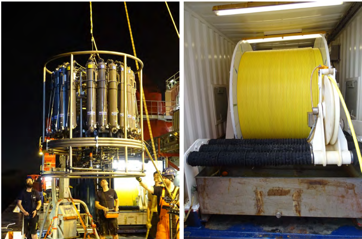
Die ultrareine Spurenmetall-CTD-Rosette des GEOMAR wird über der Steuerbordseite der TFS SONNE ausgesetzt (links). Sie wird mit einem eigenen 7000 m langen metallfreien Kabel (rechts) unter Nutzung des Schiffskrans betrieben.