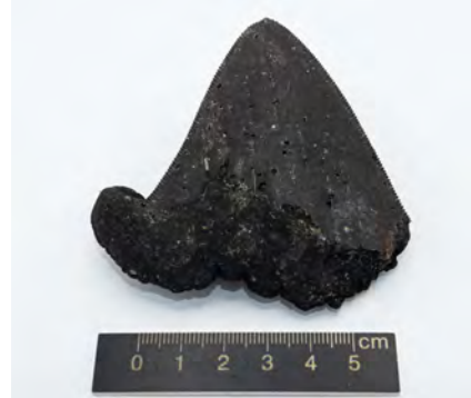
Eine etwa 10 cm dicke polymetallische Kruste durchzieht unser ROV-Untersuchungsgebiet im zentralen Teil des BGR-Vertragsgebiets (links). Die Krusten wurden für geochemische Analysen beprobt (oben rechts). Ein Megalodon-Zahn dient als Kern für die Knollenbildung (unten rechts).