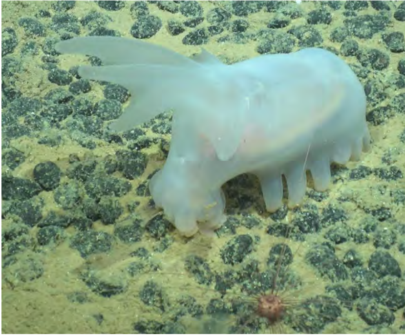
Eine Seegurke (Seeschwein) und ein Seeigel durchqueren ein Feld kleiner Knollen, während sie sich von zersetzenden organischen Stoffen und Mikroorganismen ernähren, die sie im Sediment finden.