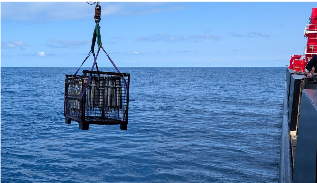
Sechszehn Releaser und zwei miniCTDs wurden an einer Gitterbox montiert und auf 2000 m Wassertiefe gefahren. Am Kabel etwa 20 m über der Gitterbox wurde eine große Sonde geklemmt, um ein Wasserschallprofil aufzuzeichnen, welches für die Bearbeitung der bathymetrischen Daten benötigt wird. Es wurden insgesamt zwei Tests vorgenommen, bevor wir unsere Fahrt zum Arbeitsgebiet fort setzten.

Am 15. Mai 2026 startete der erste Fahrtabschnitt der Expedition SO320 planmäßig und bei gutem Wetter in Yokohama (Japan). Nach ca. 4 h verließen wir die Tokio-Bucht und nahmen im offenen Pazifik Kurs auf das Arbeitsgebiet, das sich bei 35 °N/176 °E auf dem westlichen Hess Rise befindet. Die Transitzeit beläuft sich auf ca. 7.5 Tage und unterwegs fahren wir einige Seamounts an, um sie zu kartieren. Im Laufe der Reise überfahren wir die Datumsgrenze ostwärts (unser Zielhafen ist Honolulu, Hawaii), somit gewinnen wir einen Tag dazu, den wir nun schon im Transit eingeholt haben. Am heutigen zweiten Sonntag dieser Woche, haben wir mit einem erfolgreichen Releaser-Test und einer Wasserschall-Profilmessung die erste Station der Fahrt abgeschlossen und fahren unserem Arbeitsgebiet mit 10 Knoten weiter entgegen. Die Vorbereitungen der Geräte für ihren Einsatz verlaufen planmäßig.