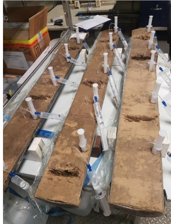
Porenwasserextraktion mit Rhizonen. Proben zum Zentrifugieren wurden bereits aus den Kernen entnommen – erkennbar an den Löchern im Sediment (rechts).

Nährstoffe müssen direkt an Bord mit einem Autoanalyser gemessen werden. Während Ammonium und Phosphat beim Abbau organischen Materials freigesetzt werden, wird Nitrat in sauerstoffarmen Sedimenten verbraucht. Daher ist die Bestimmung der Nährstoffe ein weiteres wichtiges Hilfsmittel, um die Sedimente zu charakterisieren und die biogeochemischen Prozesse zu quantifizieren.