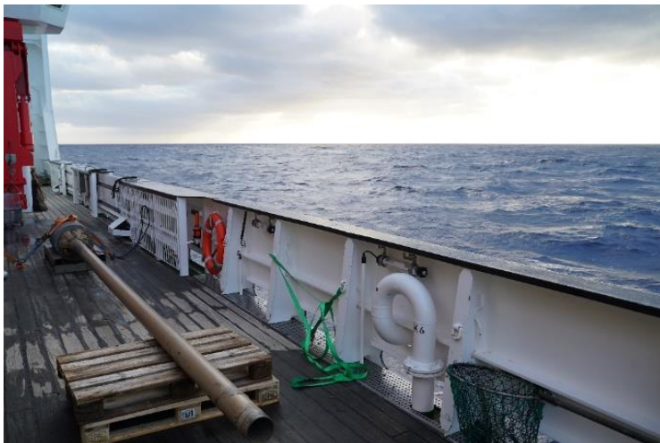
Das letzte erfolgreiche Schwerelot an Deck (oben).

Da der Einsatz des Schwerelotes eine der letzten Stationen vom 1. Fahrtabschnitt war, ist das Team der marinen Geochemikerinnen – zusammengesetzt aus dem Alfred Wegener Institute (AWI) in Bremerhaven, der Jacobs University Bremen und dem GEOMAR Kiel - immer noch damit beschäftigt, das umfangreiche Probenmaterial während unseres Transits nach Manzanillo aufzuarbeiten. Während dessen sind die anderen Gruppen bereits dabei, zu packen, aufzuräumen, Geräte zu warten und den Fahrtbericht zu schreiben. Insgesamt wurden fünf bis zu 5 m lange Sedimentkerne im deutschen und belgischen Lizenzgebiet mit dem Schwerlot gewonnen. Ein Schwerlot dieser Länge kann noch ohne das schiffseigene Kernabsetzgestell eingesetzt werden, auf das aus Platzgründen an Deck verzichtet wurde. Die Liner in den Loten waren meist gut gefüllt mit Sediment und wurden in 1 m Segmente geschnitten, sobald das Gerät gesichert an Deck stand.