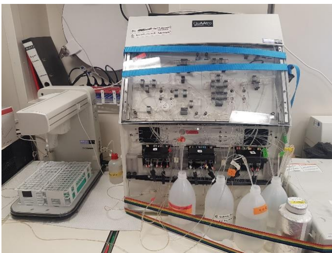
QuAAtro39 Autoanalyser für die Bestimmung von Nährstoffen an Bord.

Nährstoffe müssen direkt an Bord mit einem Autoanalyser gemessen werden. Während Ammonium und Phosphat beim Abbau organischen Materials freigesetzt werden, wird Nitrat in sauerstoffarmen Sedimenten verbraucht. Daher ist die Bestimmung der Nährstoffe ein weiteres wichtiges Hilfsmittel, um die Sedimente zu charakterisieren und die biogeochemischen Prozesse zu quantifizieren.