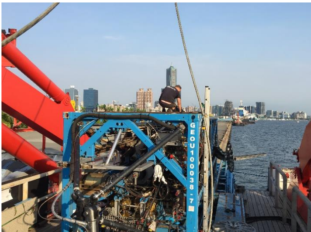
Abbildung 1: Aufbau des Meeresbodenbohrgerätes MeBo200 im Handelshafen mit Blick auf die Silhouette von Kaohsiung Downtown.

Am Montag, den 15. Oktober 2018, verließ FS SONNE um 17:12 Uhr Ortszeit seinen Liegeplatz an der Pier 7 im Seehafen von Kaohsiung, um mit dem Meeresbodenbohrgerät (MeBo200; Abb. 1) Untersuchungen zur Gashydratverteilung in den Sedimenten des taiwanesischen Kontinentalrandes durchzuführen. Dem Auslaufen unter abendlicher Stimmung (Abb. 3) gingen 5 Tage intensiver Arbeiten auf dem Schiff zur Vorbereitung der Expedition voraus. Nach Ankunft des Forschungsschiffes wurden am Mittwoch, den 10. Oktober, 2 Container der vorausgegangenen Fahrt entladen. 11 Container für die SO266-Fahrt wurden nach und nach angeliefert, wobei 9 Container auf dem Schiff verstaut wurden und ein 20'- und ein 40'-Container aus Deutschland entladen wurden. Die verlängerte Hafenzzeit ist zum Aufbau von MeBo notwendig, um das mobile Bohrsystem funktionsfähig auf der SONNE für die Reise zu installieren. Vom Liegeplatz an der Pier 7 hatte die 12-köpfige Aufbaugruppe aus Deutschland interessante Einblicke, sowohl in das urbane Treiben der 2,7 Millionen-Stadt, als auch in den Güterumschlag des größten Seehafens des Landes, der auch der dreizehntgrößte Hafen der Welt ist. Hier wird der größte Teil der taiwanesischen Ölimporte abgewickelt, die von der umliegenden Industrie verarbeitet werden.