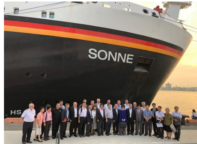
Abbildung 2: Teilnehmer des Empfanges am Freitag, den 12. Oktober an der Banana-Pier von Kaohsiung, anlässlich des Besuches von Forschungsschiff SONNE.