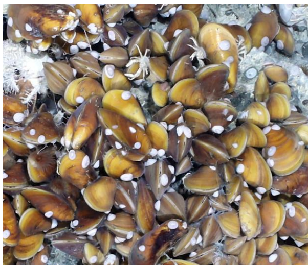
Abbildung 4: Dichtes Feld von chemosynthetisch-lebenden Miesmuscheln mit kleinen, weißen Napfschnecken und verschiedenen Krabben in 1320 m Wassertiefe auf dem Four-Way-Closure-Rücken.

Nach ca. 24 Seemeilen Fahrt überquerten wir die EEZ-Grenze Taiwans und führten eine CTD-Station zur Messung der Wasserschallgeschwindigkeit durch. Das gewonnene Wasserschallmodell wurde zur Kalibrierung des schiffseigenen Fächerecholotes genutzt und die anschließende Meeresbodenvermessung über den sogenannten „Four-Way-Closure-Ridge“ zeigte die hohe Qualität dieses modernen Vermessungssystems. Dienstag, den 16. Oktober, nutzten wir, um den neu auf dem Schiff installierten OFOS (Ocean floor observation system) einzusetzen und zwei Schwerlot-Stationen durchzuführen, während das MeBo-Team die letzten Vorbereitungen für die erste Bohrung vornahm. Nach einer weiteren Kartierung über Nacht ging am Mittwoch, den 17. Oktober, das MeBo200 des Bremer MARUMs erstmals zum Meeresboden. Die seismische 3D-Vermessung des Kieler GEOMARs während der früheren SONNE-Fahrt SO227 im Jahre 2013 ließ uns diese Bohrung sehr genau planen. Mit Hilfe einer, mit einem autonomen Unterwasserfahrzeug (AUV) vermessenen Mikro-Bathymetriekarte unserer taiwanesischen Kollegen, ließ sich die für das MeBo akzeptable Hangneigungsposition finden.