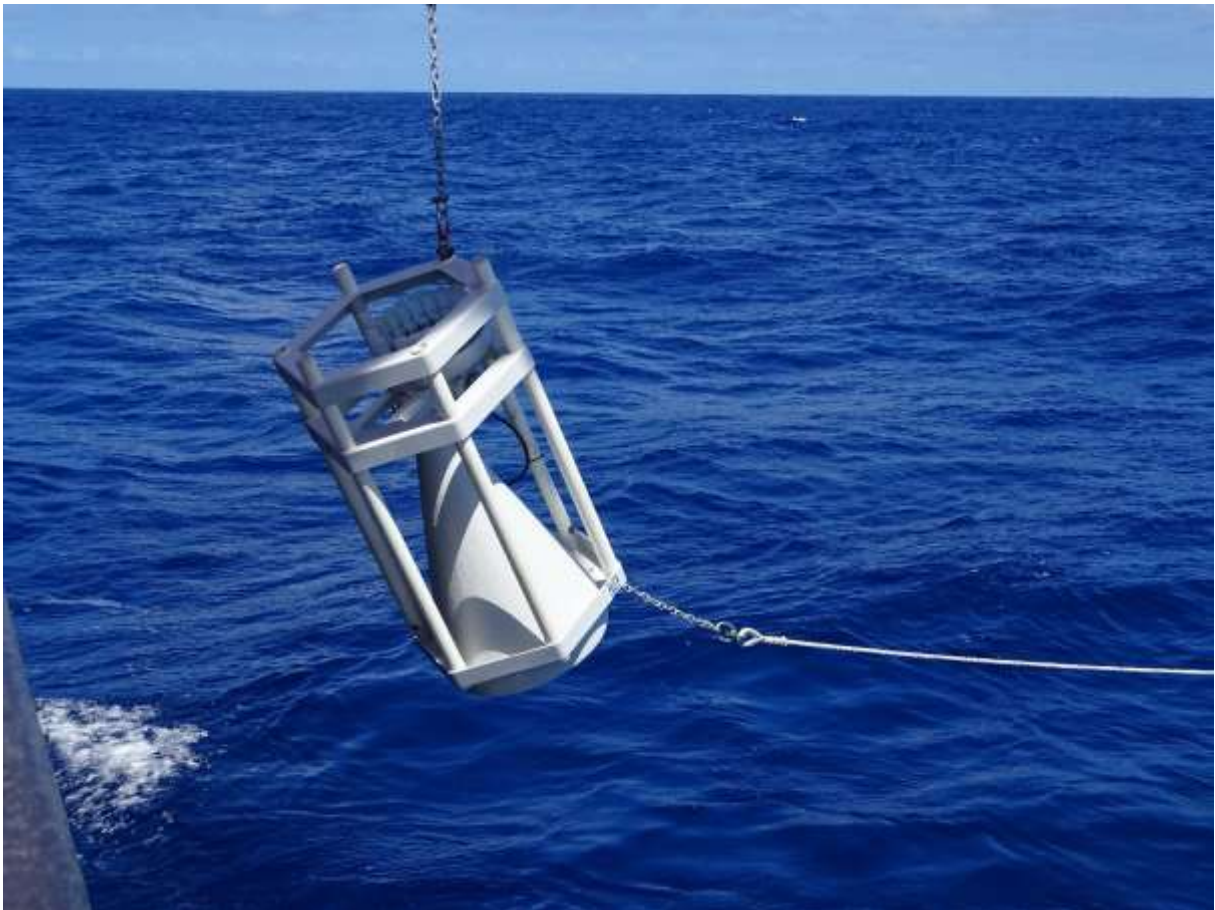
Ausbringen einer Sedimentfalle zur Bestimmung der bodennahen Sinkstoffe in Cluster 1 des deutschen Lizenzgebietes.

Gestern und heute wurden zwei Sedimentfallen mit Strömungsmessern erfolgreich geborgen, die seit der letzten Ausfahrt Ende vergangenen Jahres in den Lizenzclustern 1 und 3 im Monatszyklus Sedimentpartikel aus der Wassersäule aufgefangen und die Strömungsrichtungen aufgezeichnet haben. In Cluster 1 wurde in 500m Höhe über dem Meeresboden erneut eine Sedimentfalle für die Dauer eines Jahres verankert.