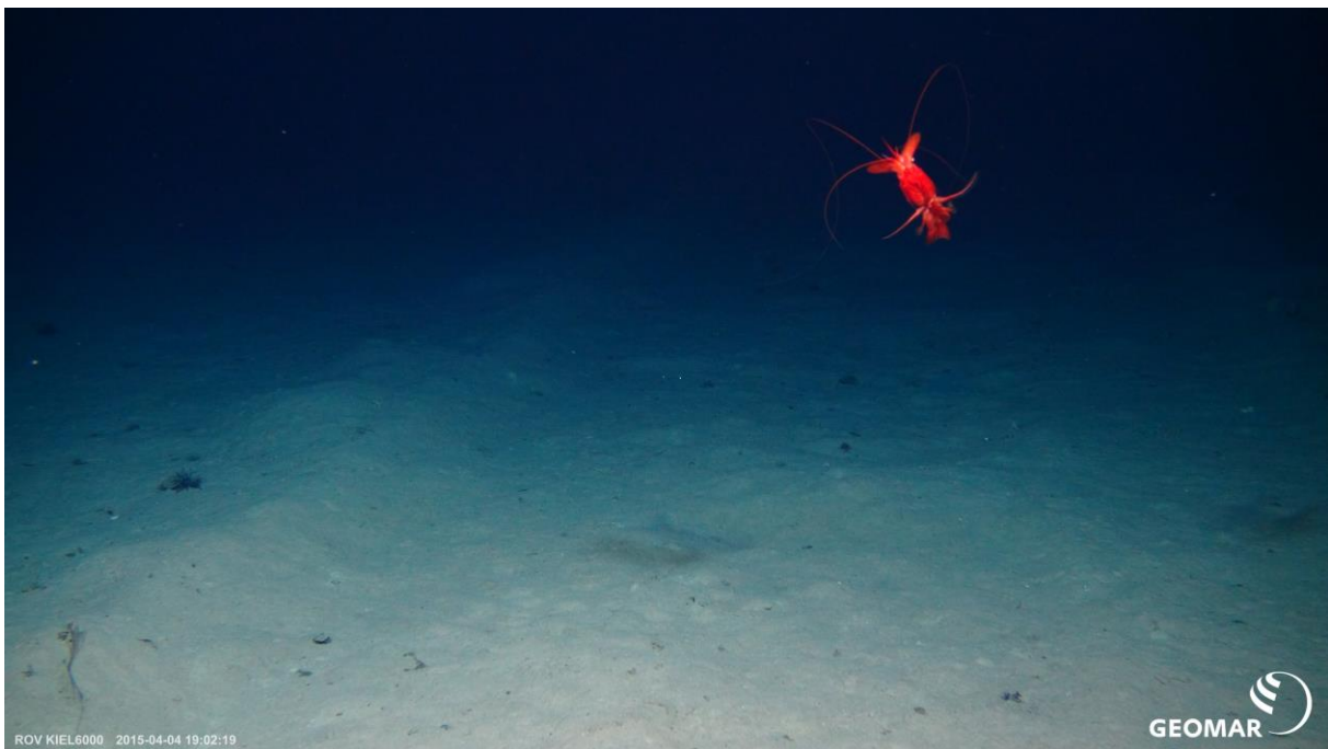
Fig. 3: Die Spur des DSRS ist nach 20 Jahre deutlich zu erkennen. Ein Schrimp beobachtet die Szene. It is easy to recognize the track of the DSRS even after 20 years. A shrimp is watching the scene.

Das IOM-BIE liegt in einen Gebiet ohne Manganknollen (Fig 4.), das damals ausgesucht wurde um den Fokus auf die Verteilung der Sedimentwolke zu untersuchen. Um die ursprüngliche ungestörte Biodiversität des Gebietes zu untersuchen haben wir ein 2 Seemeilen östlich gelegenes Manganknollenfeld ausgewählt. Dort führen wir den Epibenthoschlitten, um Macrofauna Proben zu erhalten. Ein ROV Tauchgang wurde durchgeführt um größere Megafaunaorganismen (Fig. 5-6) wie beispielsweise Schwämme und Schlangensterne zu sammeln. Videotransekte konnten in dem Gebiet eine hohe Artenvielfalt dokumentieren.