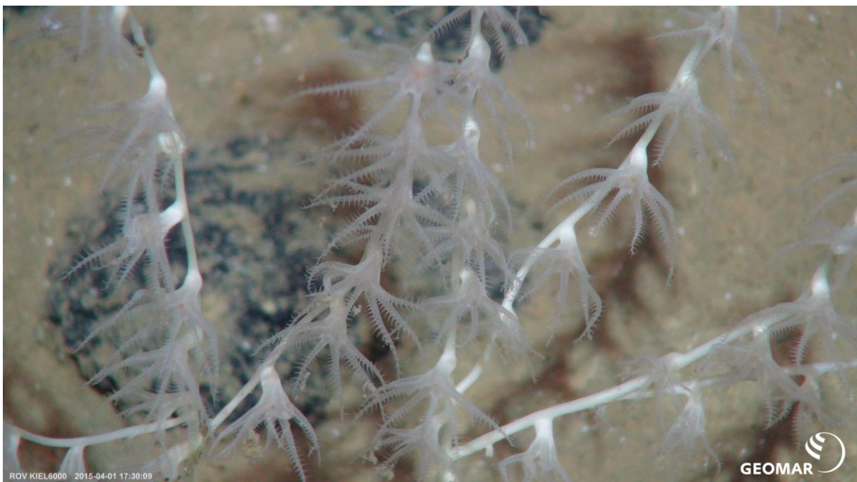
Fig. 6: Tiefseekorallen im Manganknollenfeld. Deep-sea corals in the nodule site

collect megafauna (Fig. 5-6) like sponges and brittle stars. Video transects with the ROV revealed a high diversity of creatures at the nodule site.