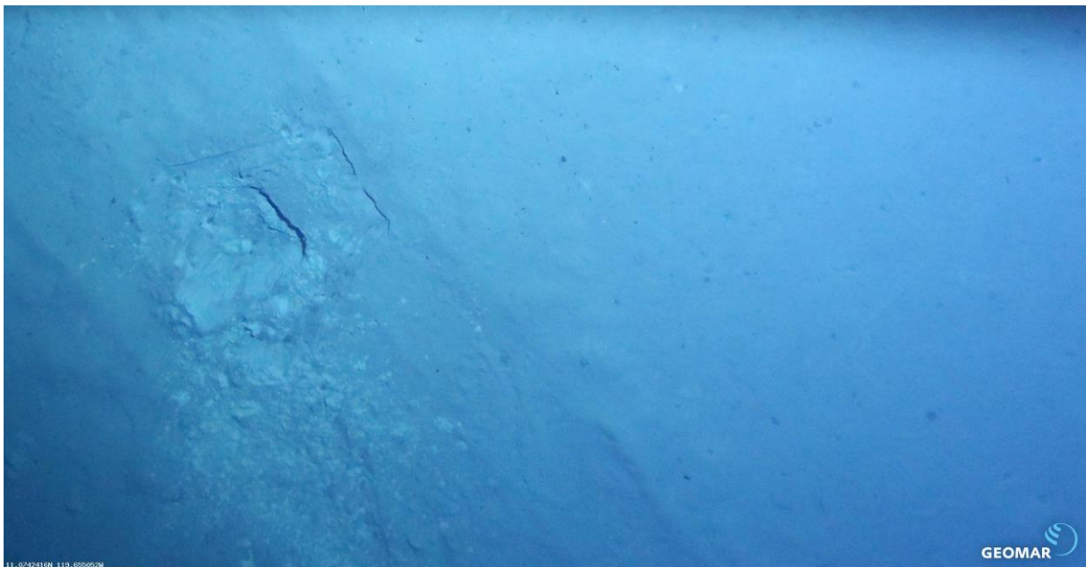
Fig. 2: Ein Kastengreifer landete genau in einer alten Spur. A Boxcorer landed exactly into the old track.

Die genaue Position der alten Spuren wurde mit dem Seitensichtsonar des AUV ermittelt. Bei einem weiteren AUV Tauchgang wurden einige ausgewählte Spuren fotografiert.