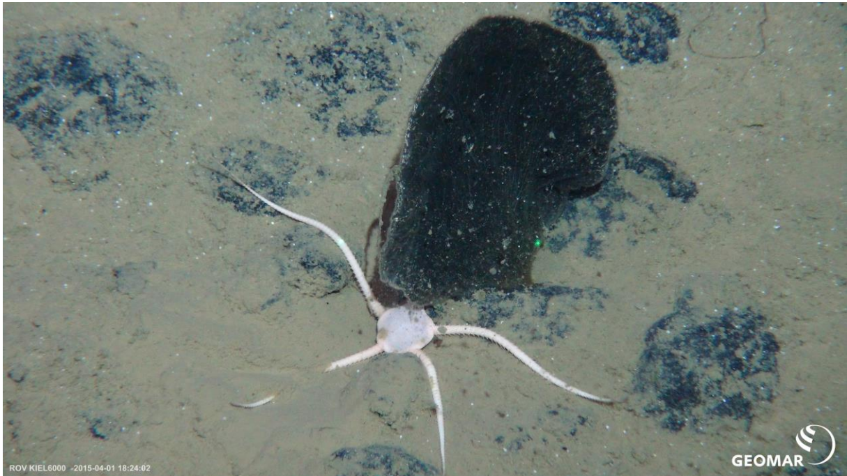
Fig.5: Ein Schlangensterne und ein Tiefseeschwamm . A brittle star and a deep-sea sponge

collect megafauna (Fig. 5-6) like sponges and brittle stars. Video transects with the ROV revealed a high diversity of creatures at the nodule site.