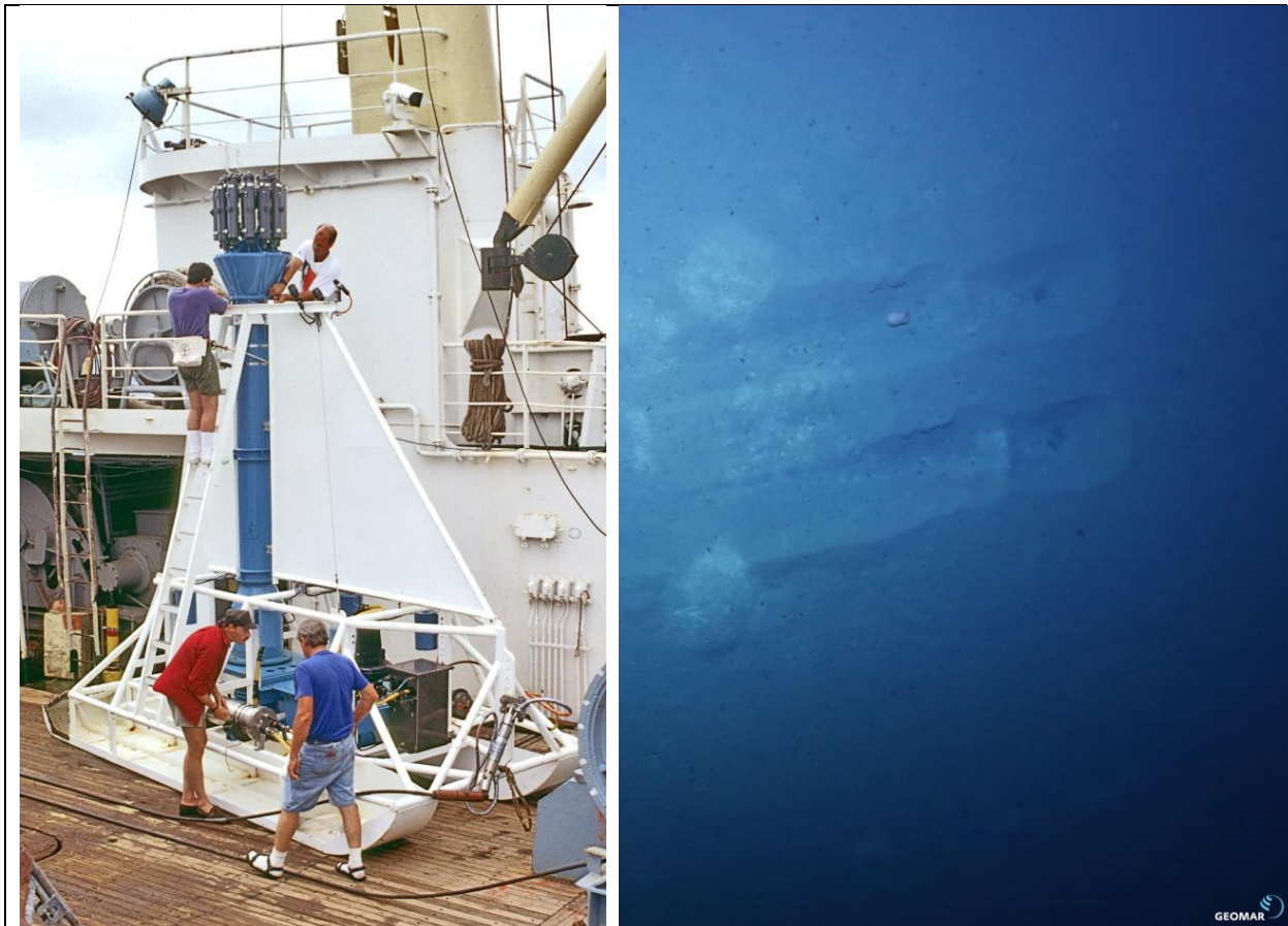
Fig. 1: Das Deep Sea Sediment Resuspension System „DSRS“ an Bord des FS Yuzhmorgeologiya in 1995 (links) , begin einer Spur, augenommen von AUV (rechts). The Deep Sea Sediment Resuspension System „DSRS“ on board RV Yuzhmorgeologiya in 1995 (left), start of trawl with this gear , photographed by the AUV (right).

Im Juli 1995 wurde im IOM ein Benthisches Störungsexperiment „BIE“ durchgeführt. Das Experiment sollte nach einem standardisierten Verfahren von unterschiedlichen Kontraktoren durchgeführt werden, um den Drift und den Einfluss der durch einen potentiellen Manganknollenabbau verursachten Sedimentwolke auf die Fauna zu untersuchen. Dafür wurde ein spezieller Schlitten entwickelt, das Deep Sea Sediment Resuspension System „DSRS“ (Fig. 1), welcher zwischen den Kufen ein Einsaugrohr mit einer starken Pumpe hatte. Das angesaugte Sediment wurde in etwa 4 m Höhe wieder ausgeblasen.