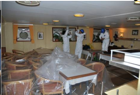
Installation der Deckenverkleidungen in der Messe