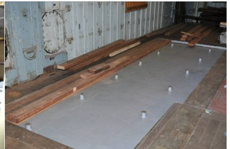
Verlegen des Holzes im WS 2

Jetzt schwimmt sie wieder und wir warten auf die Probefahrt.