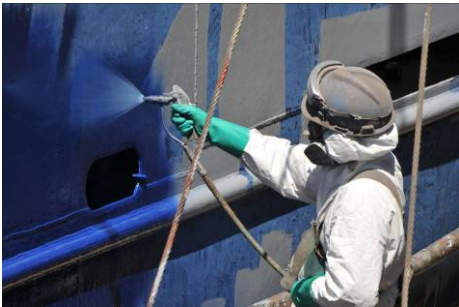
Farbarbeiten an der Außenhaut

In der Werft ist jeder freie Platz belegt und man wartet schon, dass Meteor das Dock für das nächste wartende Schiff freigibt. So langsam beginnt an vielen Stellen der Zusammenbau und das Schiff wird schön gemacht.