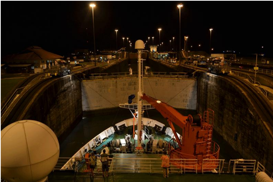
FS Meteor bei der Einfahrt in die Schleusentreppe zum Gatun See .

Am Montag, 29.10. wurde die Wartezeit auf den Lotsen für den Panama Kanal genutzt eine Fahrtvorbesprechung durchzuführen und die Labore weiter einzurichten. Gegen 18 Uhr wurden die Anker gelichtet und die erste Schleuse wurde bei Dunkelheit erreicht. Trotzdem war die Durchfahrt durch die Schleusentreppe eine sehr beeindruckende und willkommene Abwechslung zum Aufbau der Geräte. Am Dienstagmorgen, den 30.10. wurden vor Balboa Schmierstoffe übernommen und um 9 Uhr begann der Transit zur ersten CTD-Station mit einem Tag Verspätung bedingt durch die zusätzliche Wartezeit auf die Panama Kanalpassage in Cristobal.