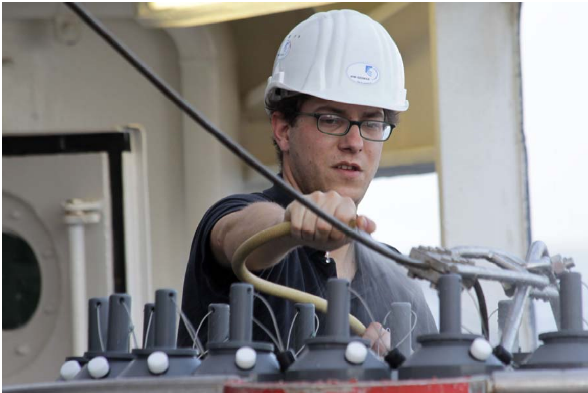
nach einem erneuten erfolgreichen Einsatz der Wasserschöpfer beim Spülen der CTD und des Rosettenrahmens mit Frischwasser.

Auf unserer Jagd nach der Markersubstanz, genannt Tracer, die letztes Jahr im April in der Sauerstoffminimumzone (Tiefe von ca. 375m) ausgebracht wurde, hat die Meteor während der vergangenen Woche über 1300 nautische Meilen zurückgelegt und war auf 26 Stationen. Nach Modellvorhersagen könnte der Tracer jetzt, 19 Monate später, über eine Fläche von 1 Million km 2 verteilt sein. Daher müssen wir uns weiter mit hoher Geschwindigkeit bewegen und eine große Fläche abdecken, wenn wir seine Verteilung hinreichend vollständig messen wollen.