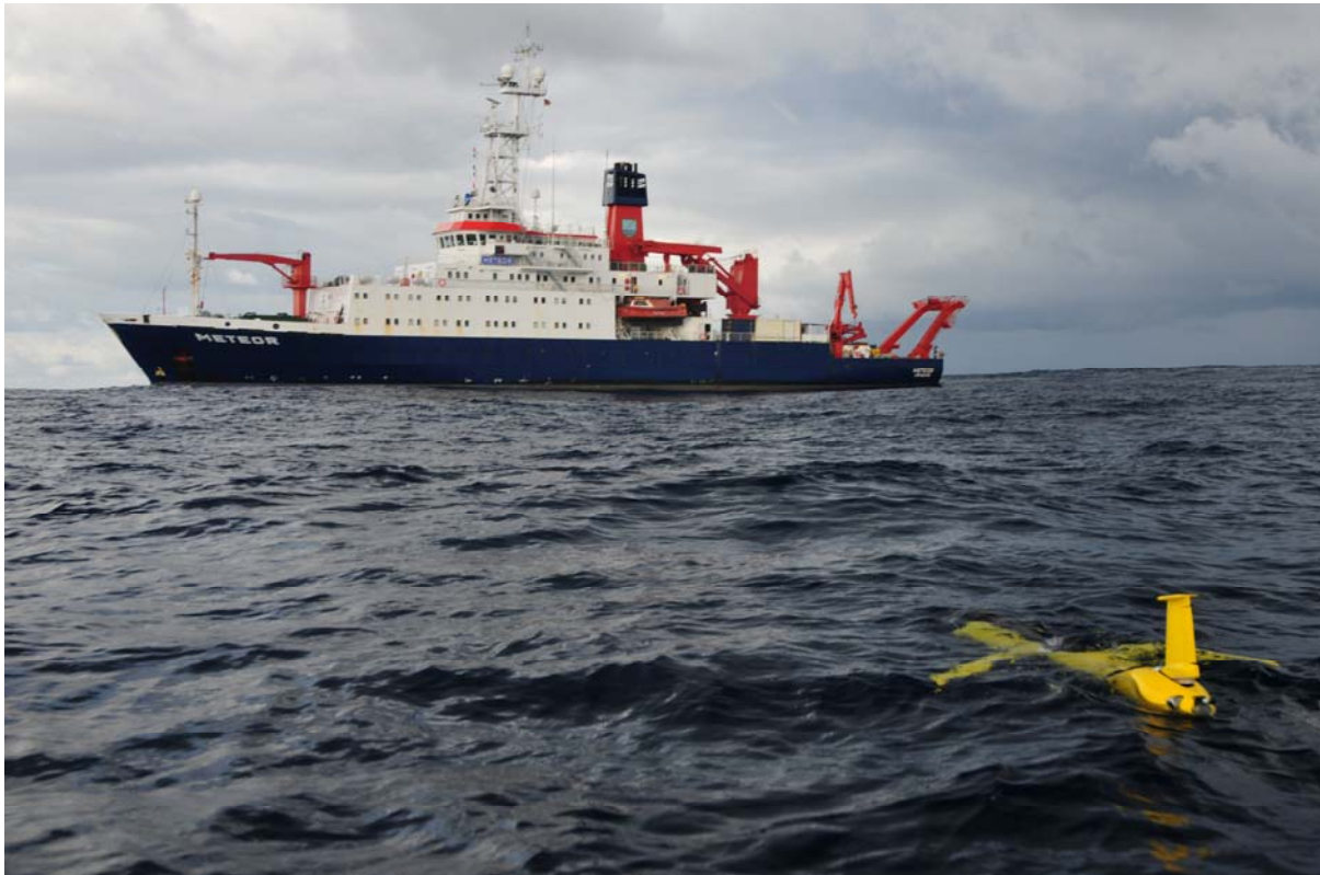
Abb. 3: Gleiter „Deepy“ vor der Aufnahme nach seiner eintägigen Mission mit der Mikrostruktursonde im Huckepack.