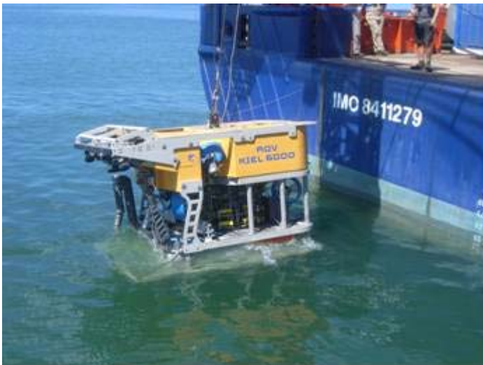
Abb. 2 Der erste Wasserkontakt des ROV Kiel 6000 beim Hafentest in Port of Spain.

der Transatlantikflüge den Weiterflug von Barbados nach Trinidad nicht bekam und so Port of Spain einen Tag später erreichte. Zudem konnte auch am 29.03. nicht mit der Aufrüstung begonnen werden, da der Hafen angesichts des anstehenden Besuchs des amerikanischen Präsidenten einer Sicherheitsüberprüfung unterworfen und für alle Aktivitäten gesperrt war. So konnten die 11 wissenschaftlichen Container erst am Morgen des 30.03. angegangen werden. Die fünf Container des ROV Kiel 6000, die zwei des AUV Abyss, und zwei Container mit wissenschaftlichem Gerät wurden an