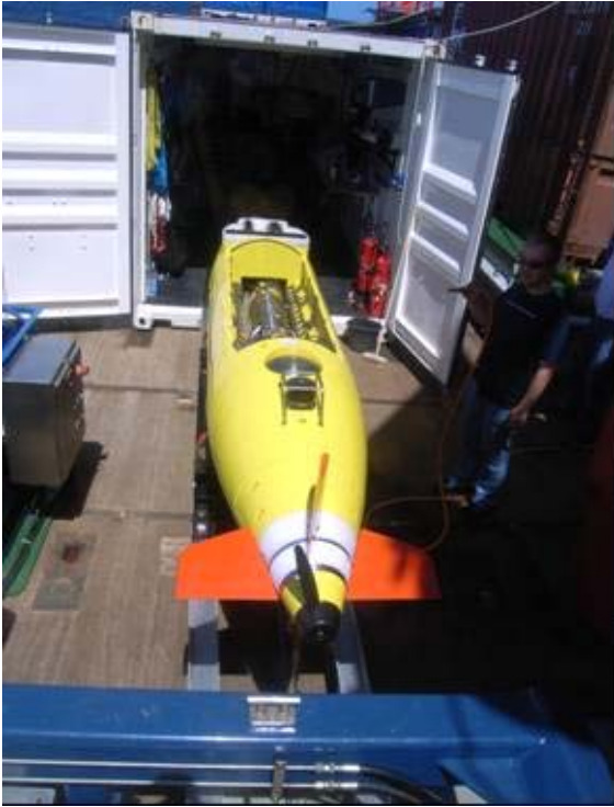
Abb. 3 Das AUV Abyss des IFM-GEOMAR mit geöffnetem Bauch vor seiner Garage, im Vordergrund ein Teil des LARS

des ROV verlief problemlos. Am Morgen des 02.04. konnte dann ein Hafentest mit dem ROV erfolgreich durchgeführt werden (Abb. 2).