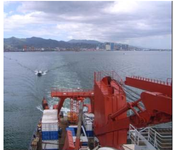
Abb. 1 Auslaufen Port of Spain

Am Mittag des 02.04. lief FS Meteor von Port of Spain (Trinidad) in Richtung des bei 4°48'S auf dem Mittelatlantischen Rücken (MAR) gelegenen ersten Arbeitsgebietes aus (Abb. 1). Die Reise findet im Rahmen des DFG Schwerpunktprogramms „Vom Mantel zum Ozean“ (SPP 1144) statt und hat die Untersuchung aktiver Hydrothermalsysteme am südlichen MAR zwischen 4° und 10°S zum Ziel. An Bord sind neben den Technikern für das ROV Kiel 6000 (ROV: remotely operated vehicle) und das AUV Abyss (AUV: autonomous underwater vehicle) eine interdisziplinäre Gruppe von Wissenschaftlern der Universitäten Hamburg, Kiel, Bremen, Hannover und Münster sowie des IFM-GEOMAR und des MPI-Bremen.