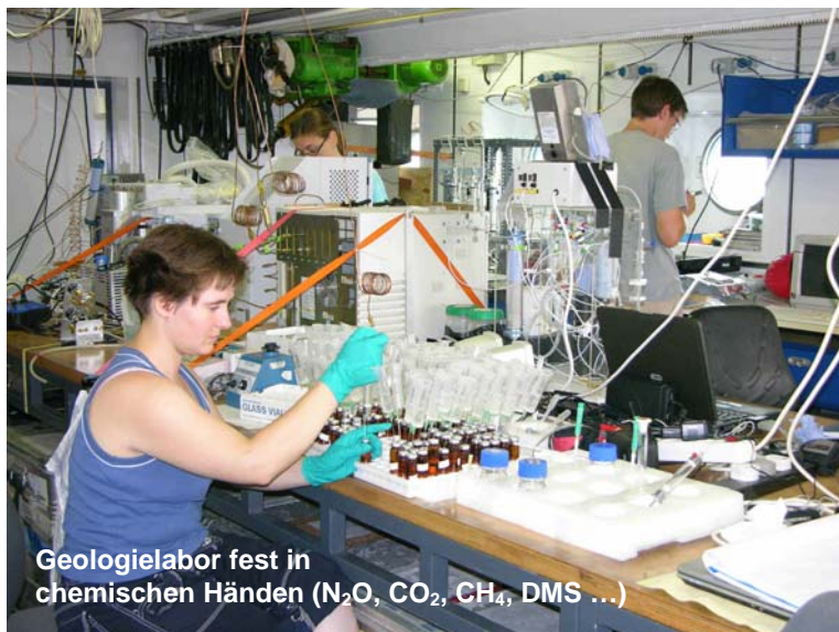
Geologielabor fest in chemischen Händen (N 2 O, CO 2 , CH 4 , DMS ...)

und Prozesse (Stickstoff-Fixierung, Ozean-Atmosphäre-Gasaustausch) eine zentrale Rolle. Auftriebsgebiete in Regionen mit starkem Staubeintrag stellen gewissermaßen biogeochemische Reaktoren dar, die gleichzeitig durch vertikale (Makro- und Mikro-) Nährstoffeinträge aus der Atmosphäre und bis zu 200 m Wassertiefe angetrieben werden. Zu beobachtende Austauschflüsse klimarelevanter Gase zwischen Ozean und Atmosphäre liegen aufgrund der hohen Sättigungsanomalien und des starken Windantriebs deutlich über den im offenen Ozean vorgefundenen Verhältnissen.