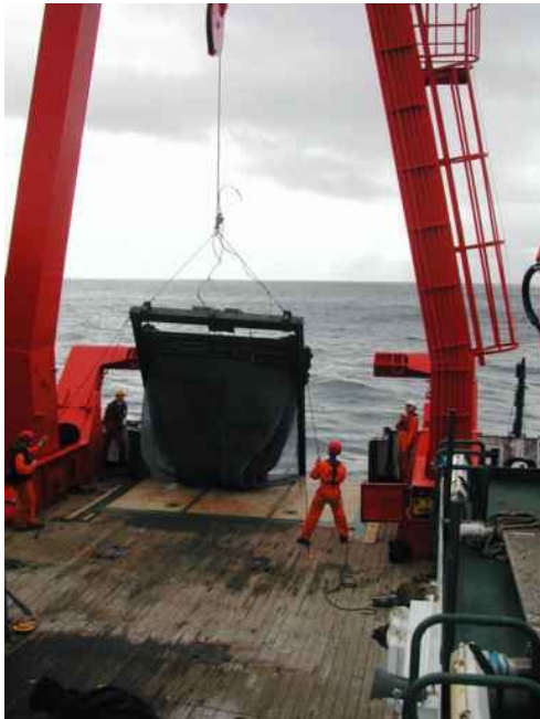
10 m 2 -MOCNESS