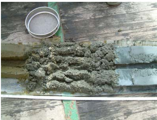
Abb. 1 Basales Konglomerat in Vibrocorerkern, links der darüberliegende Diatomeenschamm, rechts der darunterliegende blaugrüne Feinsand.

Am Ende der dritten Woche der Meteorreise M 57-3 befinden wir uns nun im Transit nach Dakar. Die Stationsarbeiten im Arbeitsgebiet vor Namibia wurden am 1. April kurz nach Mittag beendet. Der letzte Einsatz war die Einholung einer Seacat Verankerung des IOW bei 23°S, 14°E in 130 m. Hier wurden seit dem 10. Dezember kontinuierlich Sauerstoffkonzentrationen, Salinität, Temperatur, sowie Strömungsgeschwindigkeit an 4 Sensoren zwischen 20 m und 110 m Tiefe aufgezeichnet. Die Sensoren haben bis auf einen Sauerstoffsensor gut funktioniert, und werden zur Zeit ausgewertet. Die 3. Arbeitswoche war weiterhin von dem vielschichtigen Wassersäulen- und Sedimentbeprobungsprogramm dieser Fahrt bestimmt. Zu Beginn der 3. Woche wurde anhand der Parasound und SEL 96 Seismik eine weitere Vibrocorerstation ausgewählt. Auch an dieser funktionierte der Vibrocorer hervorragend. Wieder wurde das basale Konglomerat durchteuft. Im Gegensatz zu der ersten Vibrocorerstation unterlag hier dem Konglomerat keine dicke Kiesschicht, sondern es wurden feinkörnige, blaugrüne Sande gebohrt, die höchstwahrscheinlich Miozänen Alters sind. Die blaugrüne Farbe könnte möglicherweise Glaukonit andeuten.