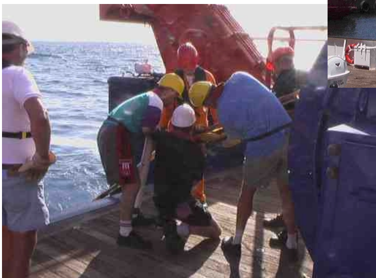
Beim Anbringen einer Boje zur Tiefensteuerung des seismischen Streamers kurz vor Beginn der Testmes- sungen