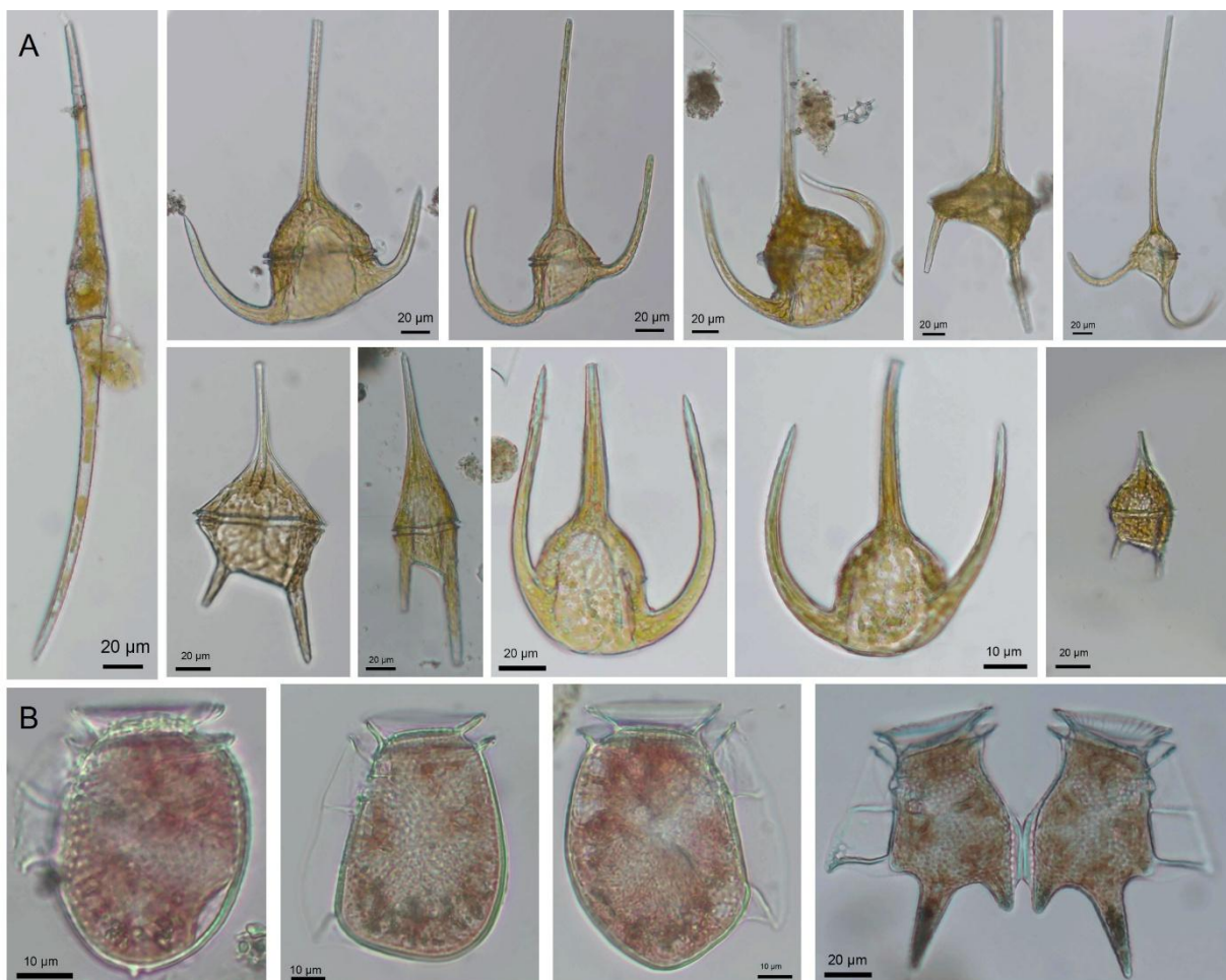
Abb. 1: Planktonalgen aus dem Untersuchungsgebiet. Verschiedene Arten von Tripos (A) und Dinophysis (B).