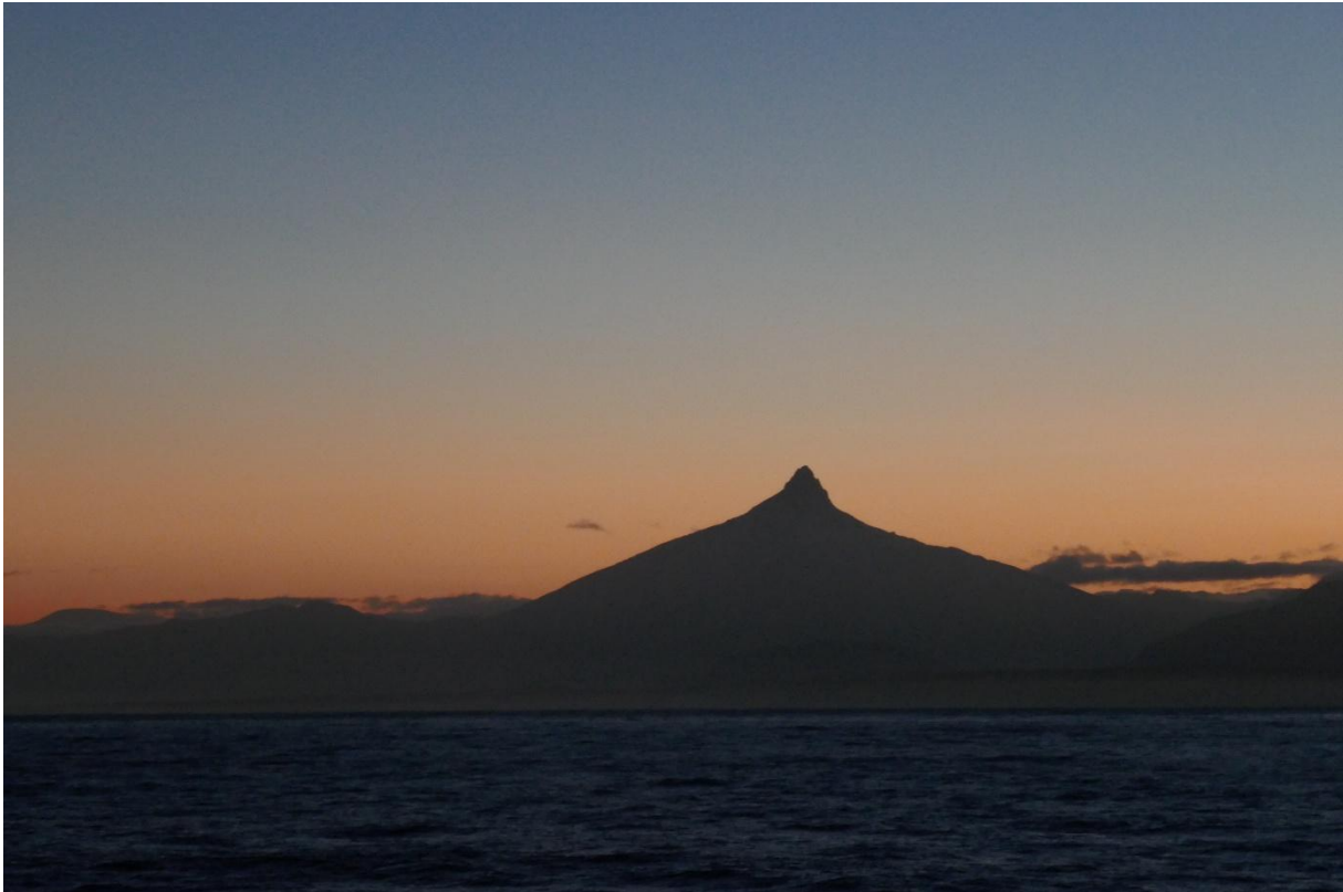
Corcovado Golf mit Blick nach Osten und der Silhouette des gleichnamigen Vulkans vor Sonnenaufgang

Mit abnehmender geographischer Breite traten im südpatagonischen Kanalsystem schließlich verschiedene Planktongemeinschaften auf, die neben Triplos und Dinophysis -Arten unter anderem durch den Yessotoxin-Produzenten Protoceratium reticulatum , durch Gonyaulax digitata oder Lepidodinium spp. und besonders durch Prorocentrum micans geprägt waren (Abb. 2B), während im nordpatagonischen Kanalsystem zunehmend Diatomeen wie Chaetoceros spp., Thalassiosira spp., Asterionellopsis glacialis , und Corethron criophilum dominierten (Abb. 3).