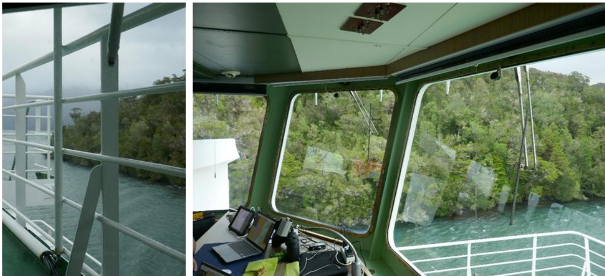
Passage durch die Englische Enge (Angostura Inglesa)

Am Montag haben wir unsere Arbeiten in der Provinz Última Esperanza im Norden der Magellan Region mit drei Stationen fortgesetzt. Ein geographisches Highlight war dabei die Passage durch die Englische Enge (Angostura Inglesa), die den Canal del Indio im Süden mit dem Canal Messier im Norden verbindet und teilweise nur 50 m breit ist. Die Passage durch Angostura Inglesa gilt als besonders schwierig und darf deswegen nur bei Tageslicht, jeweils nur in einer Richtung, nur bei Stauwasser wegen der besseren Manövrierfähigkeit und von Schiffen bis maximal 180 m Länge durchfahren werden. Aufgrund dieser Einschränkungen ist in der dunklen Jahreszeit die Durchfahrt nur an maximal einem Zeitpunkt pro Tag möglich. Dank der hervorragenden Zusammenarbeit und Planung mit den Lotsen an Bord konnten wir unsere vorherigen Stationen und Decksarbeit so terminieren, dass wir direkt nach der letzten Station vor der Enge in der Nähe von Puerto Edén die Angostura Inglesa ohne Wartezeit passieren konnten.