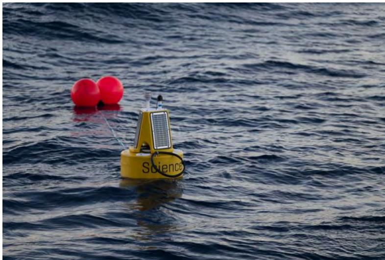
Abbildung 3: Eine der beiden auf M215 eingesetzten Kommunikationsbojen. Die Bojen dienen dem Transfer der auf den MOLAs aufgezeichneten Daten vom Meeresboden zur Wasseroberfläche und von dort in die Labore an Bord sowie langfristig in deutsche und griechische Forschungseinrichtungen.

Am folgenden Tag konnten wir die mikrobathymetrische Kartierung des Kraterbodens mit AUV Anton erfolgreich abschließen und setzten im Anschluss vier MOLA-Stationen sowie eine Boje für einen mehrtägigen Einsatz aus (Abb. 3). Am Abend des 31. Dezember kehrte die METEOR in die Caldera von Santorini zurück, um mit dem bordeigenen PARASOUND-System die Kallisti Pools mithilfe von Sedimentecholot-Profilen zu untersuchen. Aufgrund starker Fallwinde und Böen wurden die küstennahen Profile ausgelassen, und wir konzentrierten uns auf den tieferen Bereich der Caldera.