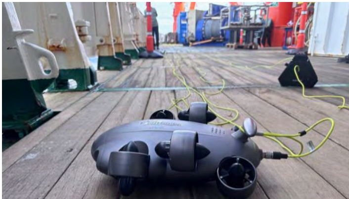
Abbildung 6: Mit einem kleinen, ferngesteuerten Unterwasserfahrzeug, ausgerüstet mit Kamera und Lichtquelle, wurde in 20 m Wassertiefe auf dem Kraterrand des Kolumbo Unterwasservulkans nach einer MOLA Station gesucht.

Anschließend verließen wir die Caldera durch die nördliche Zufahrt und steuerten los für bathymetrische Kartierungen im Nordosten der Insel an. Am folgenden Tag konnten die Kommunikationsboje und die auf dem Kraterrand des Kolumbo verbliebenen MOLA-Transponder bis auf einen erfolgreich geborgen werden. Um den Verbleib der Station zu untersuchen, setzten wir ein kleines, ferngesteuertes Unterwasserfahrzeug ein, das uns aus 20 m Wassertiefe klare Bilder des Meeresbodens lieferte (Abb. 6). Leider konnte das MOLA-Gerät nicht gefunden werden.