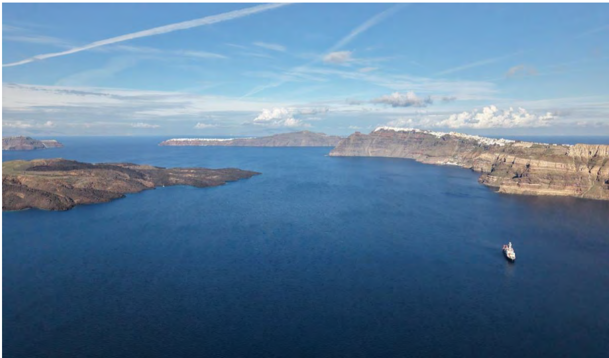
Abbildung 1: FS METEOR in der spektakulären Kulisse der Caldera von Santorini. Links im Bild ist die aktive Vulkaninsel Nea Kameni zu erkennen. Die weißen Häuser der Gemeinde Thira liegen hoch über der METEOR.

Zu Beginn unserer dritten Woche auf See konnten wir die photogrammetrische Vermessung des Caldera-Randes von Santorini abschließen. Dazu fuhren wir mit einer Geschwindigkeit von 6 Knoten entlang der steilen Küstenabschnitte innerhalb und außerhalb der Caldera (Abb. 1). Aus den aufgenommenen Fotos können wir nun ein dreidimensionales Modell erstellen, das die Calderawand mit hoher Präzision visualisiert. Damit lassen sich potenziell instabile Küstenabschnitte, die durch Felsstürze oder Hanginstabilitäten gefährdet sind, quantitativ erfassen. Das Modell wird zudem den lokalen Behörden und Schulträgern vor Ort zur Verfügung gestellt, um es im Rahmen von Bildungsarbeit und wissenschaftlichem Wissenstransfer in die lokale Bevölkerung zu nutzen.