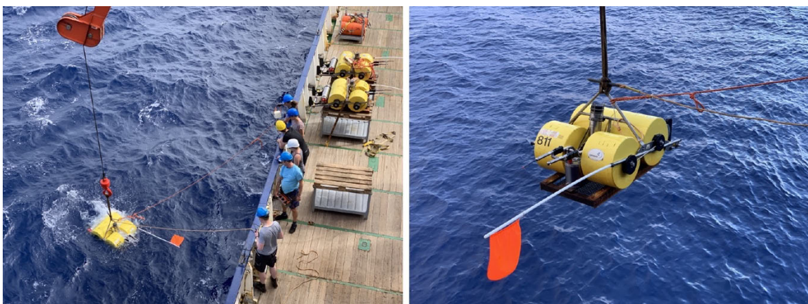
Abb. 1. Aussetzen von Ozeanbodenseismometern (OBS) von der METEOR.

Auf der Rückreise haben wir am 20. und 21. Juni auf dem Azoren Plateau, eine submarine Hochebene auf der die Inseln der Azoren liegen, insgesamt vier OBS neu ausgesetzt (Abb. 1). Dies ist Teil eines breiteren europäischen Projektes zur Untersuchung der regionalen seismischen Aktivität an den tektonischen Plattengrenzen der eurasischen, der nordamerikanischen und der afrikanischen Platte, deren Schnittstelle in der Nähe der Azoren liegt.