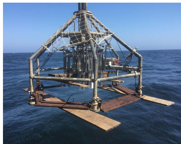
Abb.2: Multicorer mit diversen Holzanbauten, die einerseits ein zu tiefes Einsinken des Gerätes verhindern, aber auch dessen Schließen sicherstellen.

Aufgrund der bereits angesprochenen Beschaffenheit der Sedimente im Bereich des küstennahen Schlammgürtels hatten wir zunächst große Schwierigkeiten mit deren Beprobung. Erst nach diversen „Modifikationen“ des Multicorers (Abb. 2) stellte sich der Erfolg ein, der bis jetzt anhält.