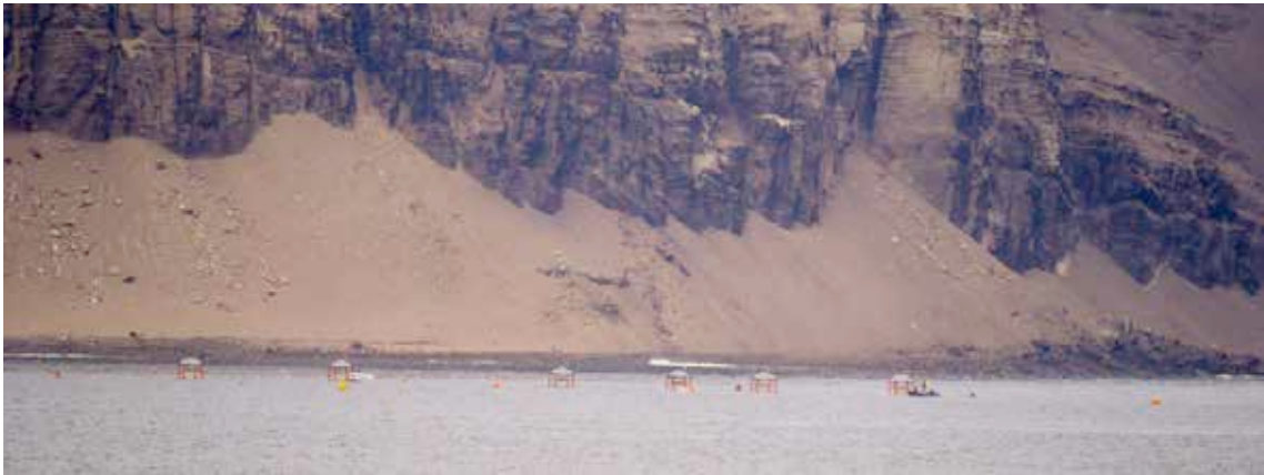
KOMOS MesoCosm Experiment der Kieler Kollegen vor Callao.

Bei der Einfahrt in die Bucht von Callao konnten wir in der Ferne die KOMOS mesocosm im Schutz der Inseln verankert liegen sehen. Das Experiment dort ist Teil