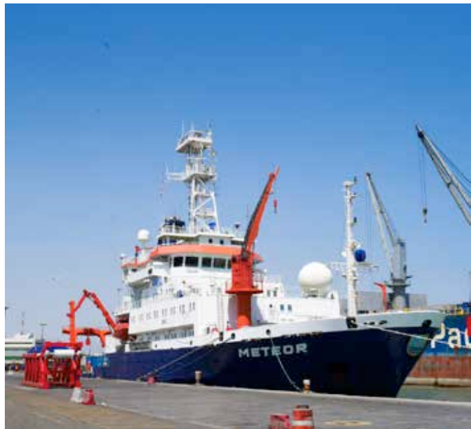
METEOR an der Pier von Callao