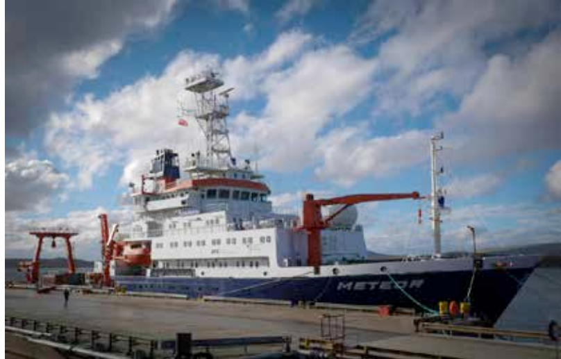
Die METEOR in Port Stanley, Falklandinseln.

Die Arbeiten in der Malvinastromregion und auf dem angrenzenden Patagonischen Schelf wurden am 11. Januar abends um 21:00 Uhr mit dem letzten MultiNetz, CTD und einer Argo Float Auslegung abgeschlossen.