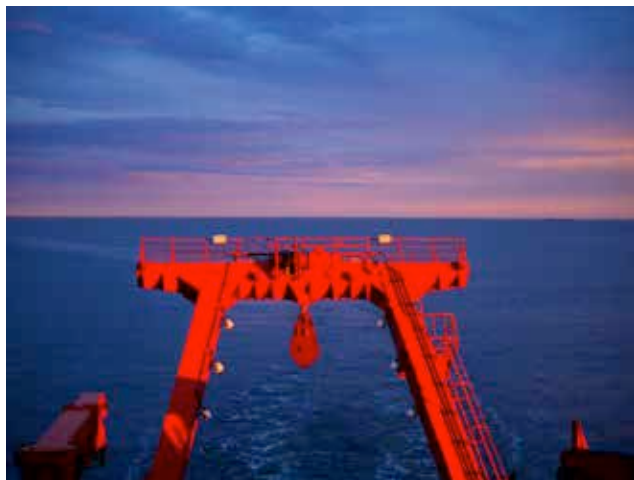
Die untergehende Sonne strahlt den Heckgalgen an bei der Ansteuerung der Falkland Inseln.