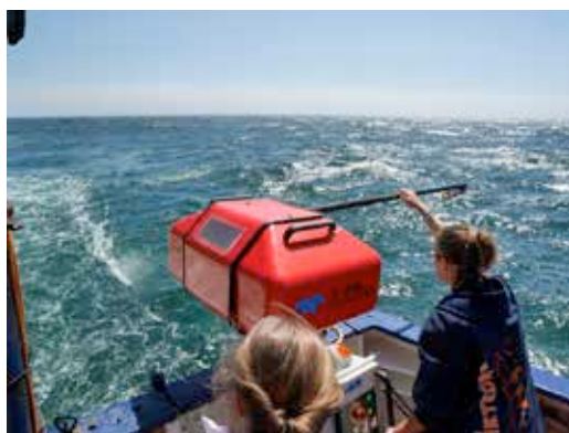
Die RapidCast Winde am Heck der METEOR spult die Leine der U-CTD Sonde ein.

mit dem Schiff zu ergänzen. Dazu haben wir auch ein recht neues Unterwegssystem eingesetzt, das RapidCast heißt und alle 4-6 Minuten ein Profil der oberen 120m Wasserschicht mit der U-CTD Sonde messen kann. Die Winde am Heck ist automatisch gesteuert und wiederholt den gewünschten Messvorgang. Die hohe räumliche Auflösung erlaubt es zum Beispiel interne Wellen auf dem Schelf zu entdecken und später zu analysieren.