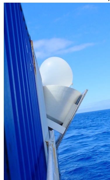
Ein Wetterballon wird gestartet

Die Meteor läuft prima, insbesondere ist auch jedes Mal wieder die Begeisterung groß wie fantastisch alles gepflegt ist und wie praktisch und sicher der Betrieb läuft.