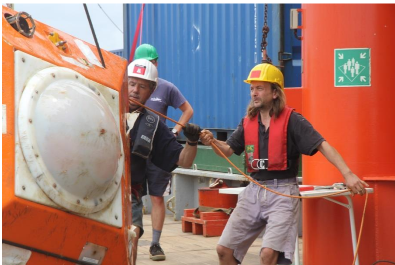
Abb. 1.: Aufnahme des Kopfes eines Bodenschilds während der Verankerungsarbeiten entlang von 11°S

Im Juli 2013 wurden während der METEOR Reise M98 - vor fast 2 1/2 Jahren - zwei Verankerungen und zwei Bodenschilde entlang des 11°S Schnitts ausgelegt. Auf Grund verschiedener Umstände konnten die ausgelegten Instrumente nicht zum geplanten Zeitpunkt geborgen werden. Wir waren daher sehr erleichtert, dass wir einen Großteil unserer verankerten Geräte wieder aufnehmen konnten. Die beiden