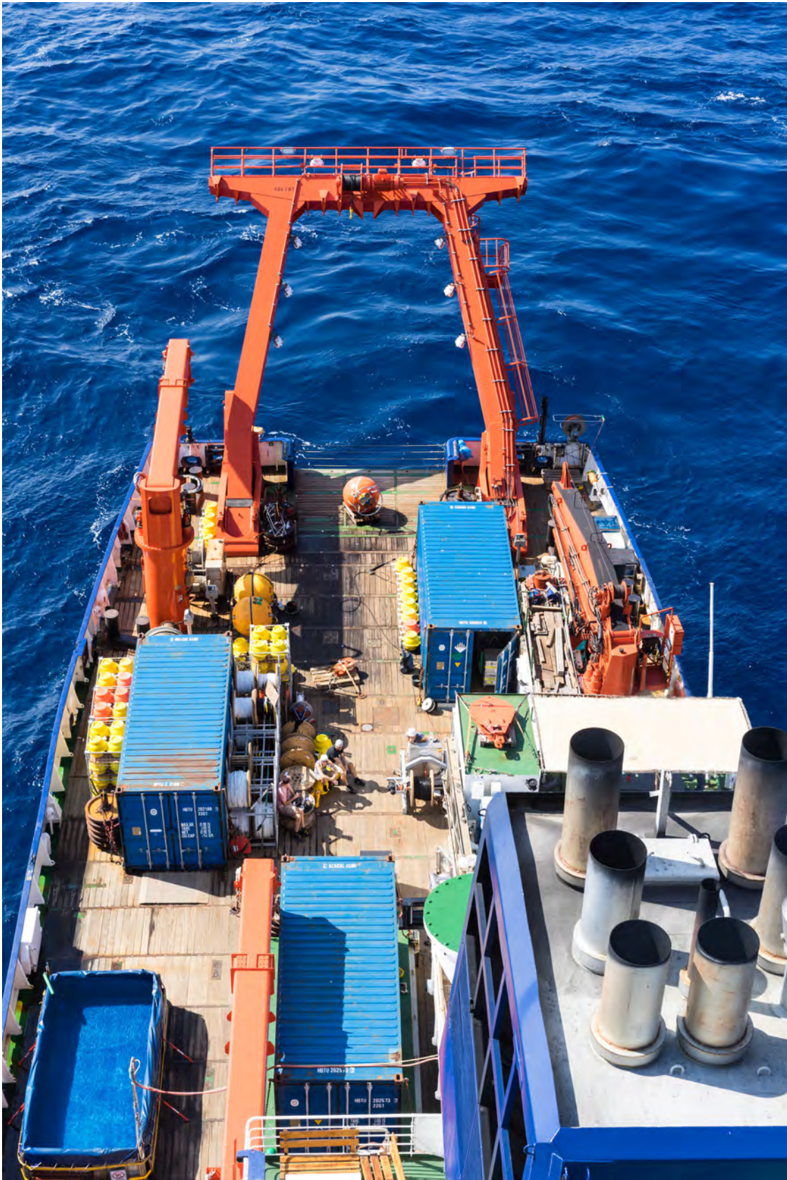
Abb. 1: Blick von der obersten Plattform des Mastes der METEOR auf das Arbeitsdeck während der Aufnahme der äquatorialen Verankerung. Die obersten Instrumente sind schon aufgenommen. Man sieht die beiden ADCPs (akustische Strömungsmesser) auf dem Arbeitsdeck, die durch ihre akustischen Signale am Ende der Verankerungsperiode bereits anzeigen, dass sie gut gearbeitet haben.