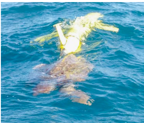
Gleiter Aufnahme mit Schildkröte.

Die ersten zwei Tage nutzten wir für eine detaillierte Vermessung eines ozeanischen Wirbels mit fast 100 km Durchmesser. Dieser Wirbel hat sich im Auftriebsgebiet vor der Afrikanischen Küste gebildet und das nährstoffreiche Wasser und Licht der Subtropen begünstigt ein starkes biologisches Wachstum. Die herabfallenden Partikel zehren den schon geringen gelösten Sauerstoff und über die vielen Wochen seit der Entstehung ist eine beeindruckende Sauerstoffminimumzone in 100m Wassertiefe entstanden. Unsere Messungen im Zentrum des Wirbels zeigten Werte von unter 5 \mu\text{mol/kg} gelöstem Sauerstoff. Im offenen tropischen Atlantik findet man nur sehr selten Minimalwerte unter 40 \mu\text{mol/kg} . Derselbe Eddy wurde von uns schon mit einem Gleiter und die Woche vor der METEOR Expedition mit dem Cap Verde Forschungskutter Islandia besucht.