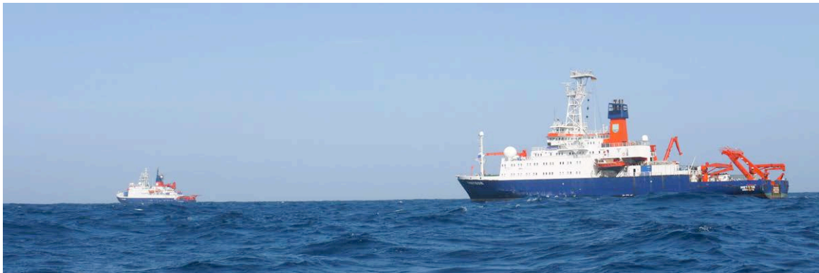
POLARSTERN und METEOR begegnen sich im tropischen Atlantik auf 11°N und 21°W.

Am Sonnabend begann das Tracer-Vermessungsprogramm mit einem CTD Schnitt entlang von 21°W von 14° 30'N in Richtung Süden. Alle 30 Seemeilen stoppen wir und nehmen Wasserproben aus den oberen 1200m. Auf jeder Station haben wir bisher den Tracer detektieren können.