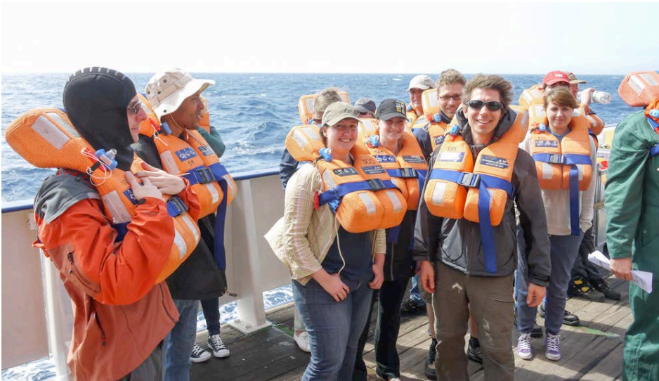
Safety First! Sicherheitseinweisung bei windigem Subtropenwetter.

Wenige Stunden nach dem Auslaufen haben wir den ersten Unterwassergleiter nördlich der Cap Verde ausgesetzt.