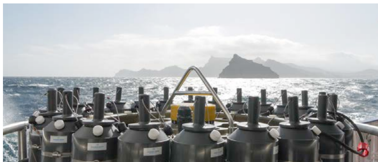
Cap Verden Inseln im Morgendunst nach dem Auslaufen

Am Montag den 17. März verließen wir pünktlich um 09:00 den Hafen von Mindelo. Damit begann eine weitere