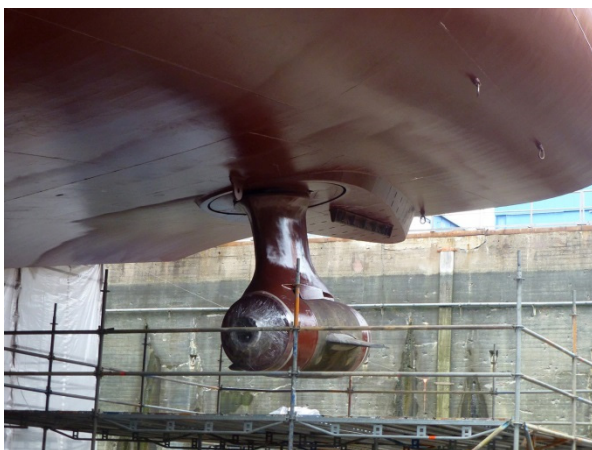
Neuer POD wurde montiert