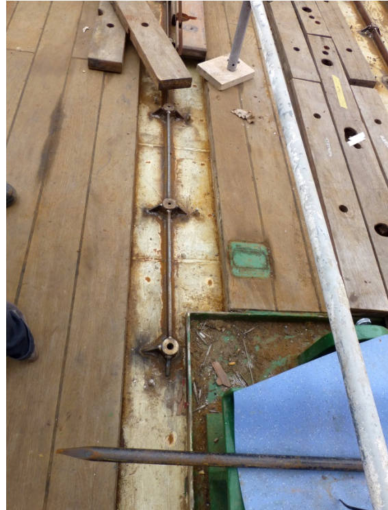
Ergänzen und verstärken des Rastersystems zum sicheren Befestigen von wissenschaftlichen Großgeräten (z.B. Meeresbodenbohrgerät )