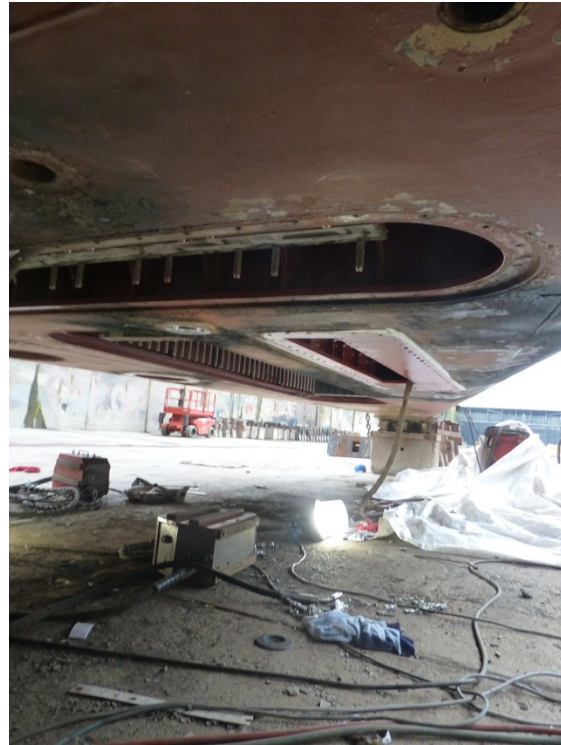
Neueinbau des Schwingers des Flachwasserecholotes