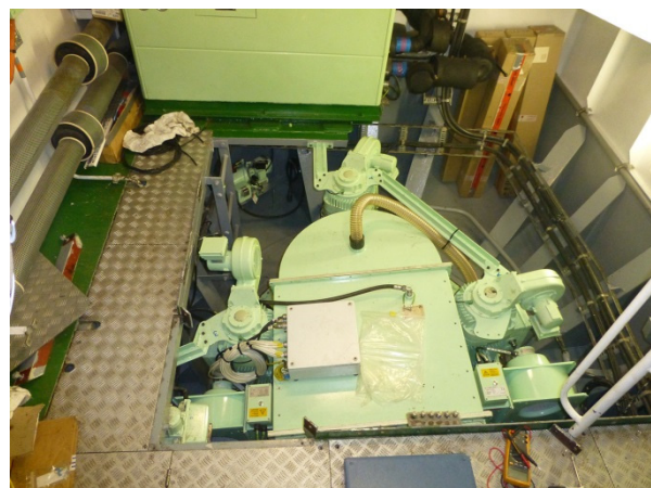
Die Anschlüsse und Ansteuerungen des neuen POD von innen gesehen