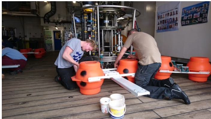
Vorbereitung von Material im Hangar der Maria S Merian, Foto: Conny Posern

Wir verfolgen unsere Route nicht nur mit den Messgeräten an Bord, sondern nutzen auch Satellitenmessungen, um über Phänomene, die sich vor uns befinden, frühzeitig informiert zu sein. So können dann vor Ort zum Beispiel Messungen mit der CTD durchgeführt werden. Zu diesen Phänomenen gehören ozeanische Wirbel, was große sich-drehende Wassermassen sind.