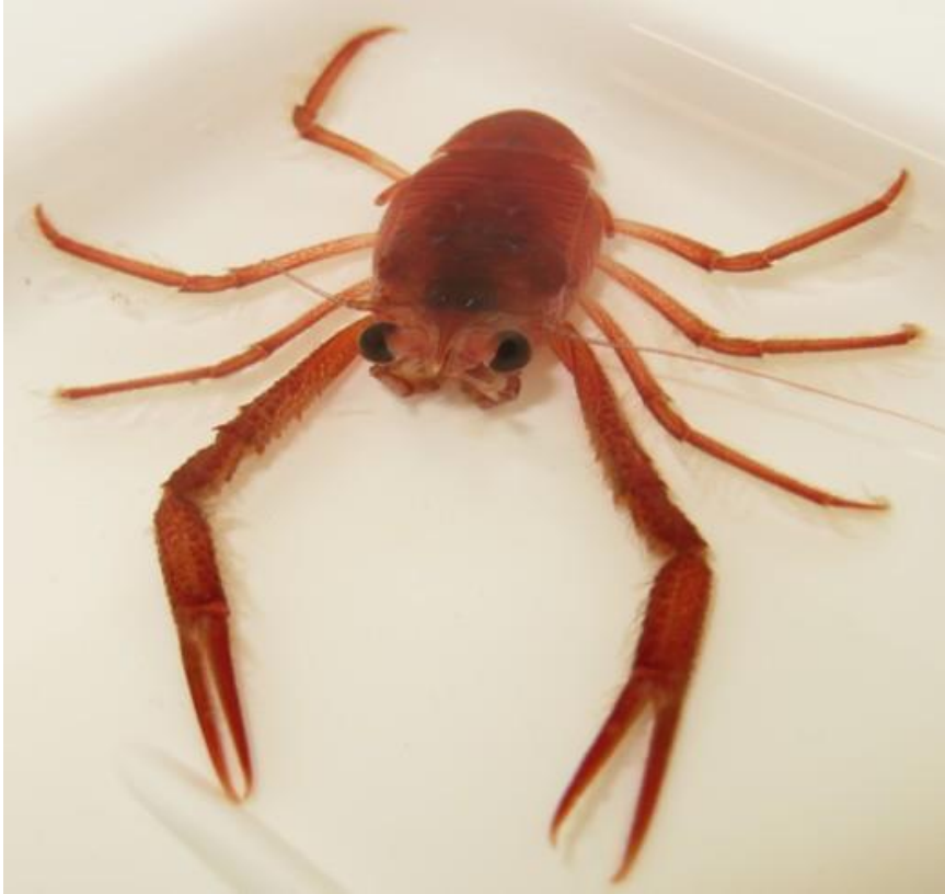
Abb. 3: Roter Springkrebs Pleuroncodes monodon .