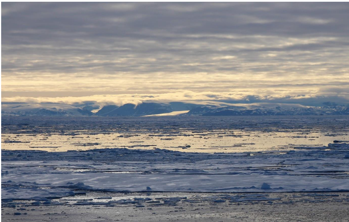
Abb. 1: Blick auf die grönländische Küste nahe des 79°N Gletschers.

Im Verlauf des Tages flauten die Winde ab. Es stellte sich aber keine Verbesserung der Meereissituation ein, sodass wir von dem Vorhaben absehen mussten, doch noch direkt vor den Gletscher zu gelangen. Wir legten eine Verankerung am Eingang zum Westwindtrog aus, die dort für die Dauer von einem Jahr die Zirkulationsschwankungen des Atlantikwassers kontinuierlich erfassen soll.