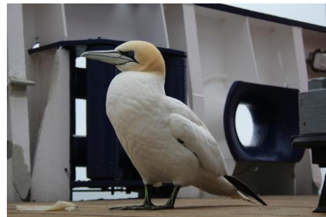
Auf hoher See besuchte uns Bertram der Tölpel - Foto: Adeline Dutrieux.

In der 3. Woche der Merian Reise MSM63 mussten wir auf Grund von technischen Problemen bis Donnerstag im Hafen von Aberdeen bleiben. Da durch die Verzögerung die Forschungszeit für einen Einsatz von RockDrill2 zu kurz geworden war, begannen die Kollegen vom British Geological Survey am Montagabend mit dem Abbau und gingen am Donnerstag von Bord. An dieser Stelle bedanken wir uns noch einmal für die gute Zusammenarbeit und hoffen, die Bohrungen nachholen zu können.