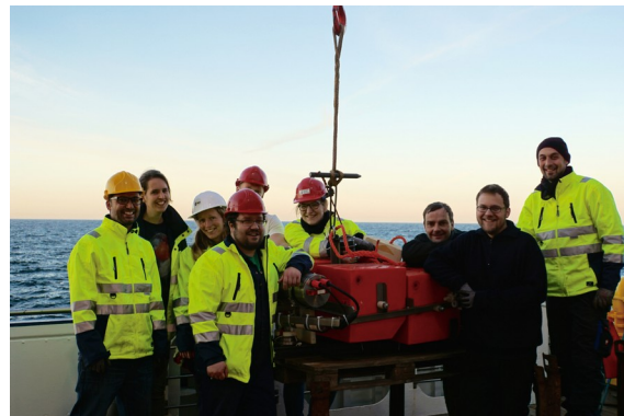
GEOMAR OBS Team nach erfolgreicher Bergung des letzten OBS.

Am Dienstag verbesserte sich das Wetter dann auf N5-6 und wir begannen um 6 Uhr morgens mit der Bergung der GEOMAR Ozeanboden-seismometer. Dies ging überaus schnell und um die Mittagszeit hatten wir bereits alle 18 Instrumente erfolgreich eingesammelt und ausgelesen. Nach dem Mittag begannen wir dann mit dem Aussetzen des reparierten P-Cable Systems. Leider funktionierte es nur für ein paar Schüsse, bevor wieder Leakage auftrat und wir beschlossen, uns von Steuerbordseite bis zum zweiten Streamer vorzutesten, den wir am Tag zuvor repariert hatten. Dieser war jedoch in Ordnung und nachdem wir gegen 18 Uhr auch beim 9. Streamer noch kein offensichtliches Problem gefunden hatten, holten wir das ganze System wieder an Deck und bauten es in den 2D Modus um, da nicht mehr genug Zeit für einen 3D Würfel zur Verfügung stand. Nach 16 Stunden Decksarbeit war das System dann gegen zehn Uhr abends einsatzbereit und wir schossen durch die Nacht hochauflösende 2D-Seismik Linien. Mit kurzen Unterbrechungen am Mittwoch und Donnerstag Morgen, lief das System dann bis zum Ende des Programms des ersten Fahrtabschnitts durch. Die 2D Seismik Daten sind von guter Qualität und nach der seismischen Datenverarbeitung nutzten wir sie wie geplant, um die beiden Bohrlokationen für den zweiten Fahrtabschnitt festzulegen.