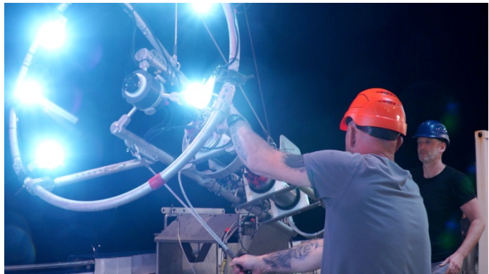
Das PELAGIOS System ist mit speziellen LEDs und einer hochauflösenden Kamera ausgestattet, um Organismen in tieferen Wasserschichten zu beobachten.

zunächst eine Teststation auf halber Strecke zu CVOO durchgeführt, um alle Handgriffe für die bevorstehende Probennahme zu optimieren. Nach durchwachsender Generalprobe (das PELAGIOS Kamerasystem hatte Startschwierigkeiten) erreichten wir dann nachmittags CVOO, wo zwei Multinetze, 2 PELAGIOS Einsätze und ein tiefe CTD (bis 14 m über Grund, 3609 m Wassertiefe) gefahren wurden. Abgesehen von ein paar nicht geschlossenen Niskinflaschen konnten wir eine gute Datenausbeute verzeichnen. Die Probennahme mit der Merian ist ein äußerst wertvoller Beitrag zu den Zeitserienbeobachtungen, da tiefe CTD Stationen hier nur sehr unregelmäßig durchgeführt werden können.