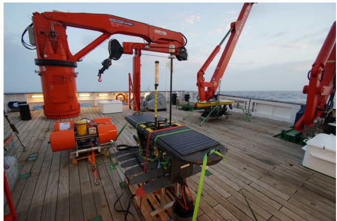
Warten auf ihren Einsatz: Zwei autonome Oberflächenfahrzeuge (Wave Glider) und ein Lander auf dem Achterdeck.

Im Anschluss an die Probennahmen bei CVOO mussten wir noch einen kurzen Abstecher bei der CVOO Verankerung 2 Seemeilen nordöstlich der Probennahmestation einlegen. Das dort installierte Oberflächenelement, welches regelmäßig Daten von der Verankerung per Satellit nach Kiel versendet, hatte erst vor 2 Tagen erneut technische Probleme bekommen. Der spontane Austausch der Oberflächenboje gegen einen Dummy wurde in höchst professioneller Weise von der Mannschaft und unseren Technikern an Bord umgesetzt. Die defekte Boje wird nun nach Kiel zurückgebracht und dort eingehend untersucht.