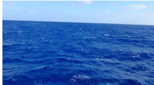
Wer findet den Tiefendrifter?

Am Dienstag haben wir eine kleine Kursänderung nach Süden durchgeführt um einen defekten Tiefendrifter zu bergen. Tiefendrifter sind selbsttätig arbeitende Messplattformen, die einmal in den Ozean