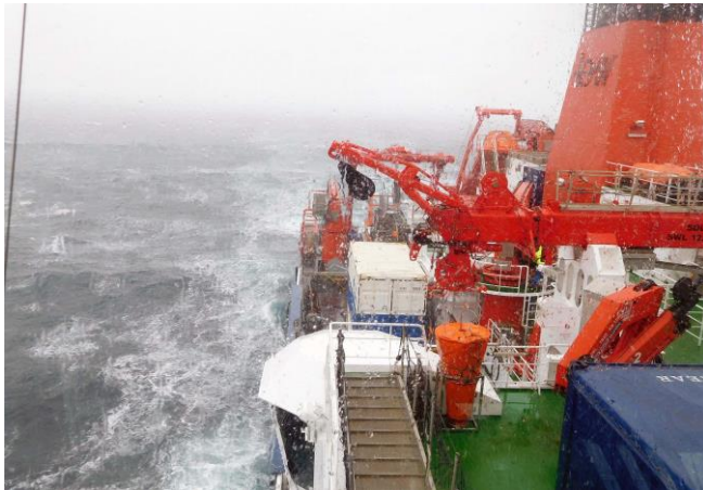
Abbildung 3: Der großer Wetterumschwung am Donnerstag mit Wind aus dem Arktischen Ozean führte zu einem Temperatursturz von 6°C und es stellte sich Schneegestöber auf der MARIA S. MERIAN ein.

wurde nun die Hauptwindrichtung aus Norden etabliert. Dieser Wind aus dem Arktischen Ozean senkte die Lufttemperatur schlagartig von 6°C auf 0° C, welches mit einem starken Schneegestöber einherging (Abb. 3). Mit dem Wind im Rücken des Schiffes ging die Fahrt nach Süden trotz des immer schlechter werdenden Wetters sehr gut. Am südlichen Ende des Profils kam die Wende und die MARIA S. MERIAN drehte auf Nordkurs, um ein Parallelprofil von Süden nach Norden anzuschließen. Hier änderte sich die Situation – die dritte Maschine wurde zugeschaltet um die Geschwindigkeit von 10 Knoten pro Stunde gegen den Nordwind einzuhalten. Dies gelang zunächst, aber als Wind und Wellen stärker wurden, wurde die MERIAN wieder langsamer. Teilweise erreichte der Wind eine Stärke von Beaufort 9 mit über 22 m pro Sekunde. Demensprechend unruhig war die Nacht und am Freitagmorgen war so manches blasse Gesicht zu beobachten.