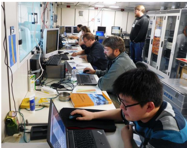
Abbildung 1: Im Hydroakustiklabor der MARIA S. MERIAN werden alle aktuellen Sonardaten des Schiffes registriert. Die Wissenschaftler können online die neuesten Daten visualisieren.