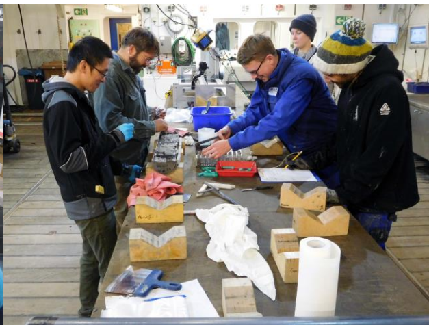
Abbildung 2: Im großen Labor des Hangars von FS MARIA S. MERIAN werden die Sedimentkerne makroskopisch analysiert und beschrieben, sowie für Porenwasser- und Gasanalyse beprobt.

Das Knipovich-Rift ist eine grabenartige Senke, die im Norden durch die Molloy Bruchzone abgeschnitten und etwa 60 km weiter westlich in der Molloy-Riftzone ihre Fortsetzung nach Norden in den Arktischen Ozean hat. Entlang eines 120 km langen Profils haben wir zunächst den Ostrand der Spreizungszone von Norden nach Süden vermessen. Der Großwetterlage hatte sich im Laufe des Tages geändert. Während wir die letzten Wochen meist Wind aus Süden oder Südwesten hatten,