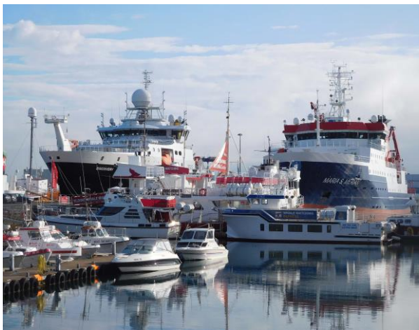
Abbildung 1: Das britische Forschungsschiff DISCOVERY und die MARIA S. MERIAN liegen an der gleichen Pier im Hafen von Reykjavik.

Am Freitag, den 29. Juli 2016 verließ FS MARIA S. MERIAN um 13:00 Uhr Ortszeit die Bunkerpier des isländischen Hafens Reykjavik, um nach einem viertägigen Transit Forschungsaufgaben am westlichen Kontinenthang von Spitzbergen aufzunehmen. Dem Auslaufen von FS MARIA S. MERIAN war eine Liegezeit an der Ægisgarður Pier vorausgegangen, wobei Wissenschaftler und wissenschaftliche Geräte der beiden Fahrten MSM56 und MSM57 ausgetauscht wurden. Neu an Bord kamen das MARUM Meeresbodenbohrgerät MeBo70 und eine ganze Reihe weiterer vorwiegend geologischer Beprobungsgeräte. Insgesamt wurden acht 20-Fuß und ein 40-Fuß Container mit Hilfe von Bootsmann und Mannschaft gelöscht. Vor allem die etwas aufwendigere