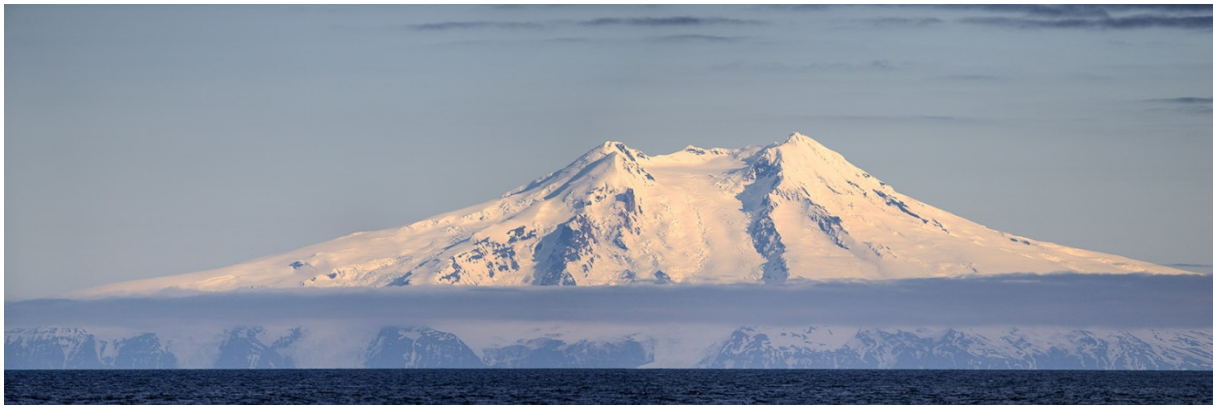
Vulkan Beerenberg auf Jan Mayen

Weite Teile des mehr als viertägigen Transits von Reykjavik nach Spitzbergen gleiten wir durch fast unheimlich spiegelglatte See. Lediglich ein unerwarteter südlicher Ausläufer der grönländischen Drifteisfelder bremst die ungehinderte Fahrt vorübergehend aus und bietet uns ein touristisch wertvolles Naturschauspiel – Sichtung von Delphinen und Walen inklusive! Eindrucksvoll auch der majestätische Vulkan Beerenberg auf Jan Mayen, der mit seinen über 2000 m Höhe Steuerbords längs zieht.