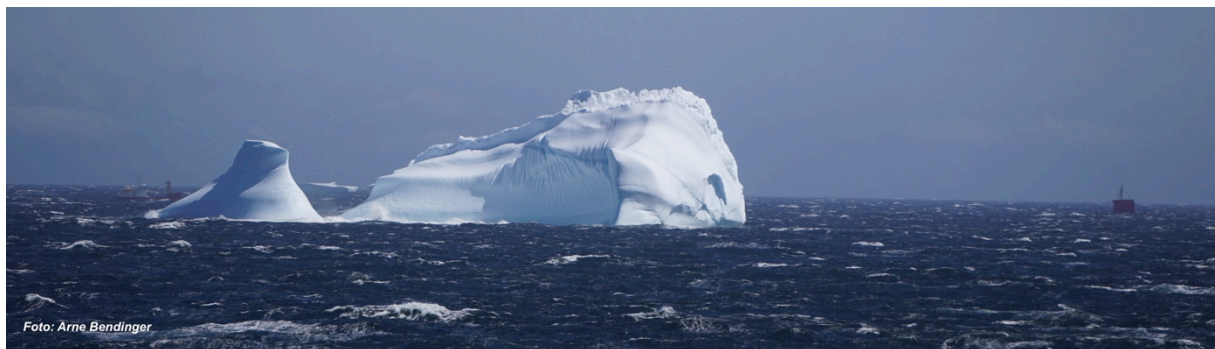
Die Draken Harald Hårfagre (rechts vom Eisberg) und die Viking Fjord (links vom Eisberg) vor der Südspitze Grönlands, aufgenommen von der Brücke der Maria S Merian

Nach dem nächtlichen Treffen mit der CCGS Hudson letzte Woche trafen wir diese Woche auf zwei weitere Schiffe: die Draken Harald Hårfagre , das größte Wikinger-Schiff das in der Neuzeit gebaut wurde, und ihr „Beiboot“ die Viking Fjord . Die Draken Harald Hårfagre ist, auf den Spuren Leif Eriksons, auf dem Weg von Norwegen nach Nordamerika und hat vor ein paar Tagen in Qaqortoq, nahe Kap Farvel, einen Zwischenstopp eingelegt, bevor die Reise über die Labrador See angetreten wurde. Wir trafen Sie bei Windstärke 8 bis 9 Bft von Eisbergen umgeben und gefolgt von der Viking Fjord (die deutlich mehr mit der See zu kämpfen hatte als das Wikinger Schiff).