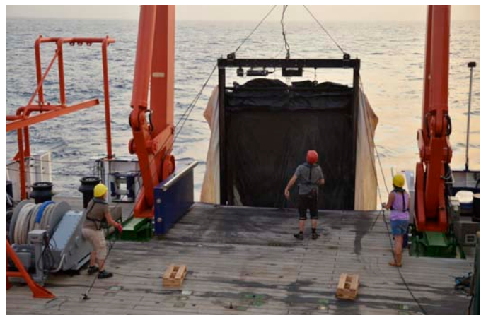
Das 10m 2 -MOCNESS wird ausgesetzt