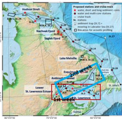
Abb. 1: Untersuchungsgebiet der zweiten Expeditionswoche (blau gerahmt)

Abbildung 1 zeigt das Untersuchungsgebiet der zweiten Woche im nördlichen Teil des Golf von St.