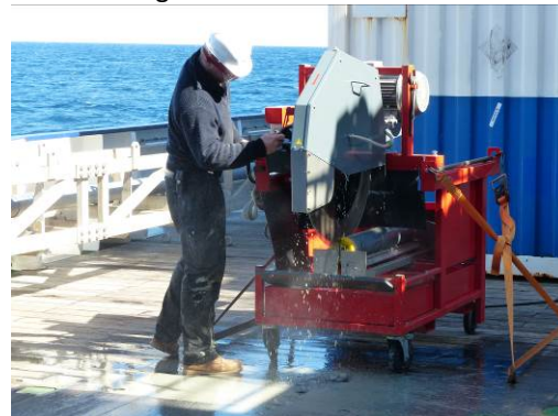
Aufsägen der eingefrorenen Schwerelotkerne