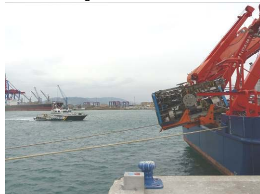
MeBo beim Hafentest – unter interessierter Beobachtung der Guardia Civil