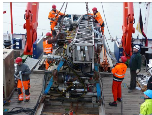
MeBo wird mit dem Kran auf dem Achterdeck der Merian abgesetzt