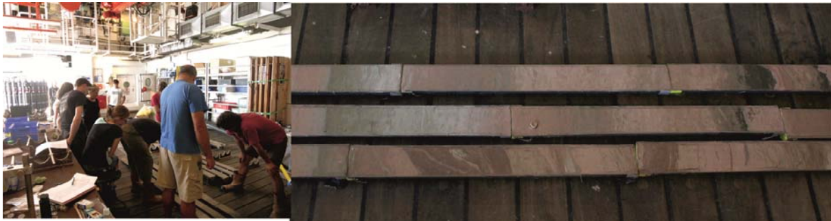
Abb 3: Intensive Diskussion der Kerne (links) die den Übergang von einem Schuttstrom (unten rechts) über leicht deformierte Sedimente (oben rechts) zu ungestörten Hintergrund-Sedimenten zeigen (mitte rechts).

Am Abend des 18.10. wurde TOBI gemeinsam mit der Seismik bei optimalen Wetterbedingungen ausgesetzt, um zwei ca. 50 Seemeilen lange Profile über die Abrisskante und den oberen Rutschungsbereich aufzuzeichnen. TOBI zeigt in diesem Bereich relativ geringe, homogene Rückstreuwerte, was vermutlich an einer ca. 6 m mächtigen ungestörten Sedimentschicht oberhalb der Rutschungsablagerungen liegt. Die Seismik zeigt im Bereich der Abrisskante ein stufenförmiges Muster aus einer Reihe von rotierten Blöcken. Da die TOBI-Daten in dem Gebiet der Abrisskante im Vergleich zu den bathymetrischen Daten keine nennenswert neuen Informationen erbrachten, brachen wir den TOBI-Survey am Abend des 19.10. ab. Die Nacht wurde für weitere seismische Messung über die Rutschung genutzt. Am 20.10. hatten wir dann einen dicht gedrängten Geologie-Tag mit insgesamt 5 Kernstationen. Die ersten drei Kerne sind inzwischen geöffnet und der Transect zeigt einen extrem interessanten Übergang von Schuttstrom-Ablagerungen über leicht deformierte Schichten zu ungestörten Sedimenten (Abb. 3). Diese Kerne werden eine detaillierte Rekonstruktion des Fließverhaltens des Schuttstromes in diesem Bereich ermöglichen. Morgen werden wir einen letzten Kern im Bereich der Rutschung nehmen, bevor wir uns dann Richtung Schelf bewegen, um den Sedimenttransport vom Schelf in den oberen Bereich des Canyon zu untersuchen.