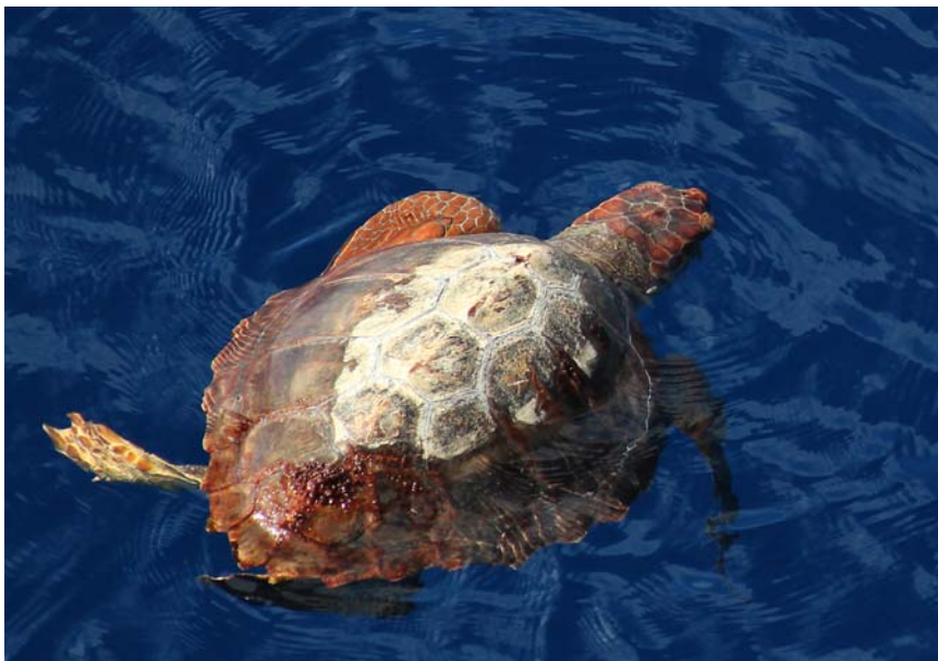
Abb. 4: Schildkröte ( Caretta caretta ) im Arbeitsgebiet.