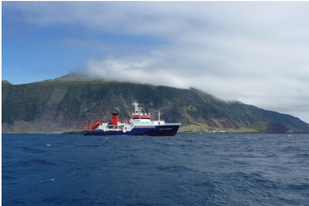
Abbildung 3: FS Maria S. Merian vor Tristan da Cunha, 25.1.2012.