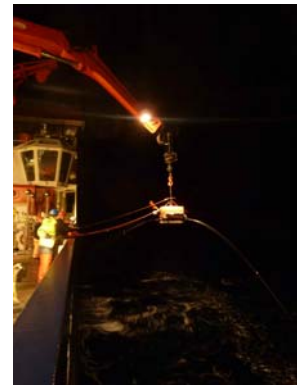
Abbildung 1: Links: Der Stationsplan um Tristan da Cunha. Gelb markiert sind Stationen die sowohl mit OBS und OBMT belegt sind, rot Stationen an denen nur ein OBMT ausgelegt werden. Rechts: Aussetzen der ersten OBM Station in der Nacht von Sonntag, den 22.1. auf Montag den 23.1.

Nach Erreichen des Arbeitsgebietes in der Nacht vom 22.1. auf den 23.1. wurde mit dem Auslegen der 24 OBS und 26 OBMT begonnen und die Arbeit der Wissenschaftler auf einen 24 Stundenbetrieb umgeschaltet. Die 24 Stunden werden mit 6 vierstündigen Schichten abgedeckt, wobei jeder Wissenschaftler 2 Schichten abdecken muss. Die Stationen sollen um die vermutliche Lage des Tristan da Cunha Hot-Spots herum verteilt. Die Größe des Arbeitsgebietes erfordert eine recht hohen Abstand zwischen den Stationen, die zu erwartende 3D Struktur der Hot-Spotanomalie ein flächenhafte Abdeckung mit Instrumenten (siehe Abbildung 1). Um den vorherrschenden Strömungs- und Windrichtungen am besten Rechnung zu tragen, werden die Stationen entlang Nord-Süd Profilen ausgelegt.