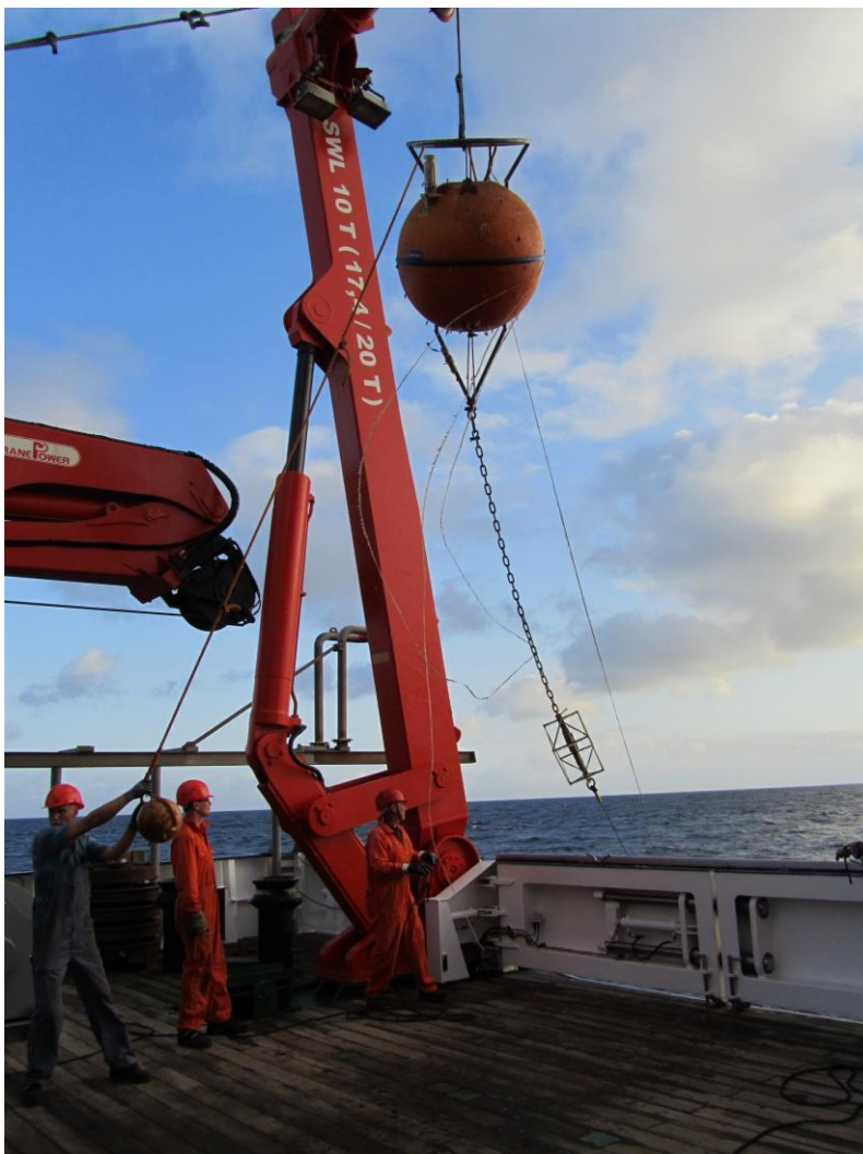
Abb. 1: Aufnahme der Kopfboje der Verankerung bei 8°N, 23°W. Direkt unter dem Auftriebselement befinden sich Sensoren zur Vermessung von Temperatur, Salzgehalt und Sauerstoff. Die Geräte befinden sich in einem Käfig und sind so gegen Beschädigung geschützt (Photo: Johannes Hahn).

Am 11. Mai 2011 begann die MERIAN-Reise MSM18/2 in Mindelo, Kap Verde. Diese Forschungsfahrt ist Teil des DFG Sonderforschungsbereichs 754 „Klima-Biogeochemie Wechselwirkungen im tropischen Ozean“ und des BMBF Verbundprojekts „Nordatlantik“. Kern der Untersuchungen im Rahmen des SFB 754 ist das sauerstoffarme Gebiet im tropischen Nordatlantik. Mit Hilfe von physikalischen und biogeochemischen Untersuchungen sollen Veränderungen des Sauerstoffgehalts nachgewiesen werden. In einem Teilprojekt des BMBF Verbundvorhabens „Nordatlantik“ soll die Rolle des Ozeans für Klimaschwankungen im atlantischen Raum untersucht werden. Insbesondere sollen Strömungen und Vermischungsprozesse am Äquator sowie deren Auswirkungen auf die Meeresoberflächentemperatur mit Hilfe von Verankerungen, schiffsgestützten Instrumenten und autonomen Gleitern vermessen werden.