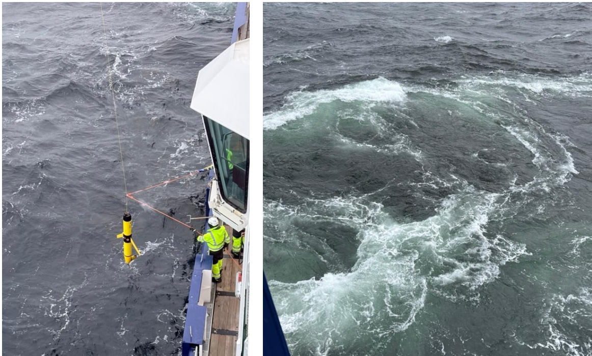
Abbildung 2: (Links) Bergung eines Gliders nach einer 13-tägigen Mission durch einen antizyklonalen Wirbel westlich der grönländischen Küste. (Rechts) Die grünliche Färbung des Wassers, wahrscheinlich im Zusammenhang mit der intensiven Frühjahrsblüte in der Labradorsee, mit Oberflächen-Chlorophyll-a-Konzentrationen von bis zu 15 \text{ mg m}^{-3}

darauffolgenden Tag. Die Glider waren etwa 14 Tage im Wasser, was unter diesen Bedingungen bemerkenswert ist. Alle Plattformen funktionierten einwandfrei und lieferten einen wertvollen Datensatz.