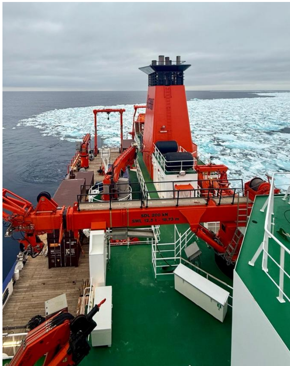
Abbildung 1: CTD-Station in der Nähe des Inlandeises am Schelfrand vor Kanada

Wir befinden uns nun in unserer dritten Woche auf See an Bord des FS MARIA S. MERIAN im Rahmen der Expedition MSM142. Die Wetterbedingungen haben sich im Verlauf der letzten Woche stetig verbessert, sodass wir kontinuierlich Fortschritte bei den geplanten Arbeiten erzielen konnten. Ich möchte mich bei der Schiffsbesatzung sowie bei den technischen und wissenschaftlichen Teams für ihr Engagement und ihre Einsatzbereitschaft bedanken. Die Zusammenarbeit war herausragend, insbesondere während der langen Arbeitszeiten an Deck unter kalten und häufig eisigen Bedingungen, trotz gelegentlicher sonniger Abschnitte.