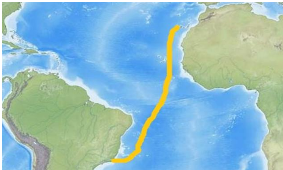
Abb. 3 Das Arbeitsgebiet der Fahrt 141-2 Fig. 3 The working area of cruise 141-2

Sargassum, a brown algae found in large numbers in the Atlantic, is also sampled, and larger organisms such as crabs and molluscs are analysed for their gut contents, also using molecular biology. This allows a further, higher level of microbial food web to be examined in addition to the microbial food web.