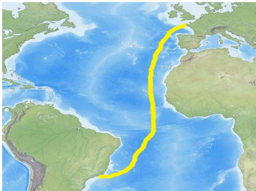
Abb. 2 Das Arbeitsgebiet der Fahrt MSM140/2 entlang internationaler Gewässer auf der direkten Strecke von Brest nach Rio de Janeiro.

Further, high-spectrally resolved light field measurements of the incoming solar radiation and the water-leaving radiation will be conducted that can be combined with the atmospheric data to evaluate further satellite products. One goal is to combine information on the light field from different instruments to evaluate the data quality of the permanently installed broadband radiation sensors. The idea is to use this data to establish a quality control scheme that can be used to routinely provide quality-controlled broadband radiation data for RV MARIA S. MERIAN cruises in the future, potentially as part of the project Underway Research Data.