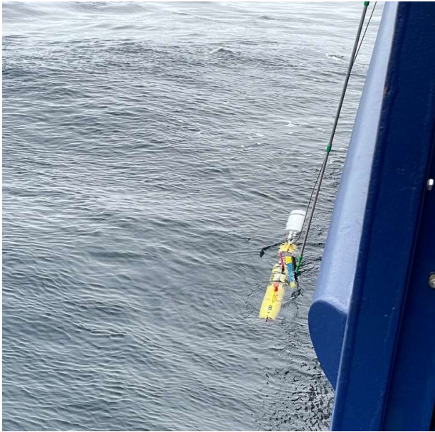
Abbildung 2 Bergung eines REMUS AUV.

Wir sind jetzt auf dem Weg zum OSNAP-Array (Westen), um die Sauerstoffsensoren an den Verankerungen zu kalibrieren. Diese Stationen werden außerdem als abschließende Tests für andere Geräte an Bord genutzt. Danach werden unsere Sturmjagd-Abenteuer beginnen!