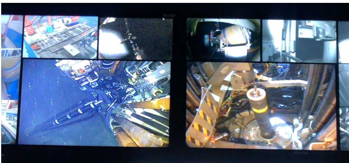
Abbildung 1 Blick auf einige der Kontrollbildschirme innerhalb des MeBo-Steuercontainers. Hier bereiten die Piloten das Abhebemanöver zurück zur MERIAN vor. Rechts unten mit weißem Deckel und gelber Markierung ist ein Bohrloch-Observatorium zu sehen, das am Meeresboden verbleibt und während des Hiebens im Loch der Bodenplatte des MeBo verschwinden wird.

Insgesamt ist es uns gelungen, in der vergangenen Woche drei Bohrlöcher durch Decksedimente in die Ozeankrustenbasalte abzuteufen. Zwei der Bohrlöcher sind als Pärchen auf einem relativ jungen Teil der Ozeanrückenflanke platziert worden in einem Abstand von ca. 80 Metern. Über einen Zeitraum von zwei Jahren sollen der Chemismus der Krustenfluide sowie die Temperaturänderungen tief im Bohrloch aufgezeichnet werden.