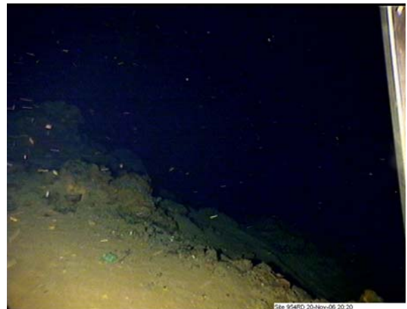
Einsatz des Rockdrill 2 nahe eines „smoking crater“

Erstes Ziel waren Kerne in der Nähe der sogenannten "Smoking Crater", wobei wir nachweisen konnten, dass der Untergrund im Logatchev Hydrothermalfeld häufig aus alteriertem Gesteinsmehl besteht und die Sulfide nur als dünne Kruste dicht unterhalb des Meeresbodens auftreten. Neben dem Rockdrill wurde mittels Kongsberg EM120 eine detaillierte bathymetrische Vermessung in der Umgebung des Logatchev Feldes durchgeführt, die eine deutlich höhere Auflösung hat als die bisher vorliegenden Daten. Dabei konnten auch neue sturkturgeologische Erkenntnisse für die Lage des Feldes gewonnen werden. Aus den an Bord erstellten Blockdiagrammen wird die vermutliche Störungskontrolle des Hydrothermalfeldes deutlich.