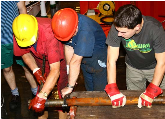
Öffnen eines Rockdrill 2 Kerns

Bei der Ankunft im Arbeitsgebiet wurde zunächst ein Wasserschallprofil genommen, um die geplanten bathymetrischen Kartierungen und das Positionierungssystem (Posidonia) für die Einsätze an den Geräten zu kalibrieren. Die Forschungsarbeiten der ersten Woche konzentrierten sich aber natürlich auf den Einsatz des Rockdrill. Nach ersten Kernen aus dem Bereich der östlichen Flanke des Mittelatlantischen Rückens in Wassertiefen von ca. 1800 m wurde das in 3000 m Tiefe liegende Logatchev Hydrothermalfeld angegangen.